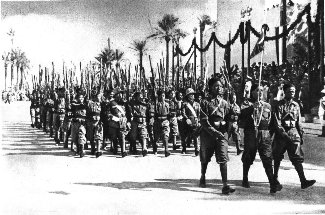
كتيبة من شبان ليتوريو العرب