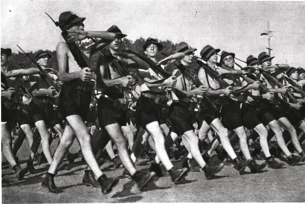
شبان الطليعة يتمرنون على التعاليم العسكرية الخاصة بالجنود المسبق اوان قر عتهم العسكرية