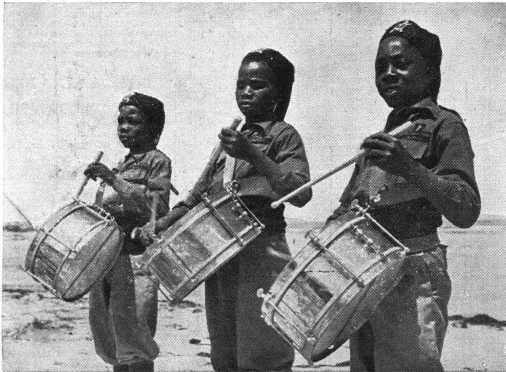
Fig. 3 : Discipline des corps et uniformisation des comportements. On note au passage la présence de jeunes noirs, contrairement à la volonté initiale d'Italo Balbo