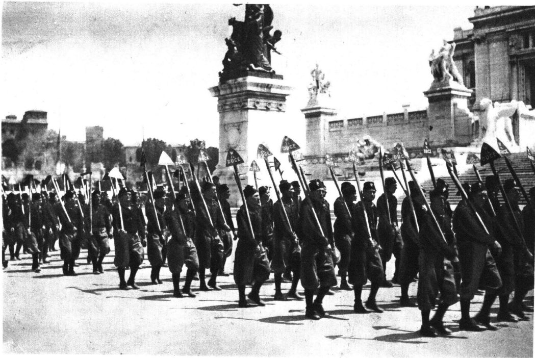
شبان فاشيستيون فلاحون