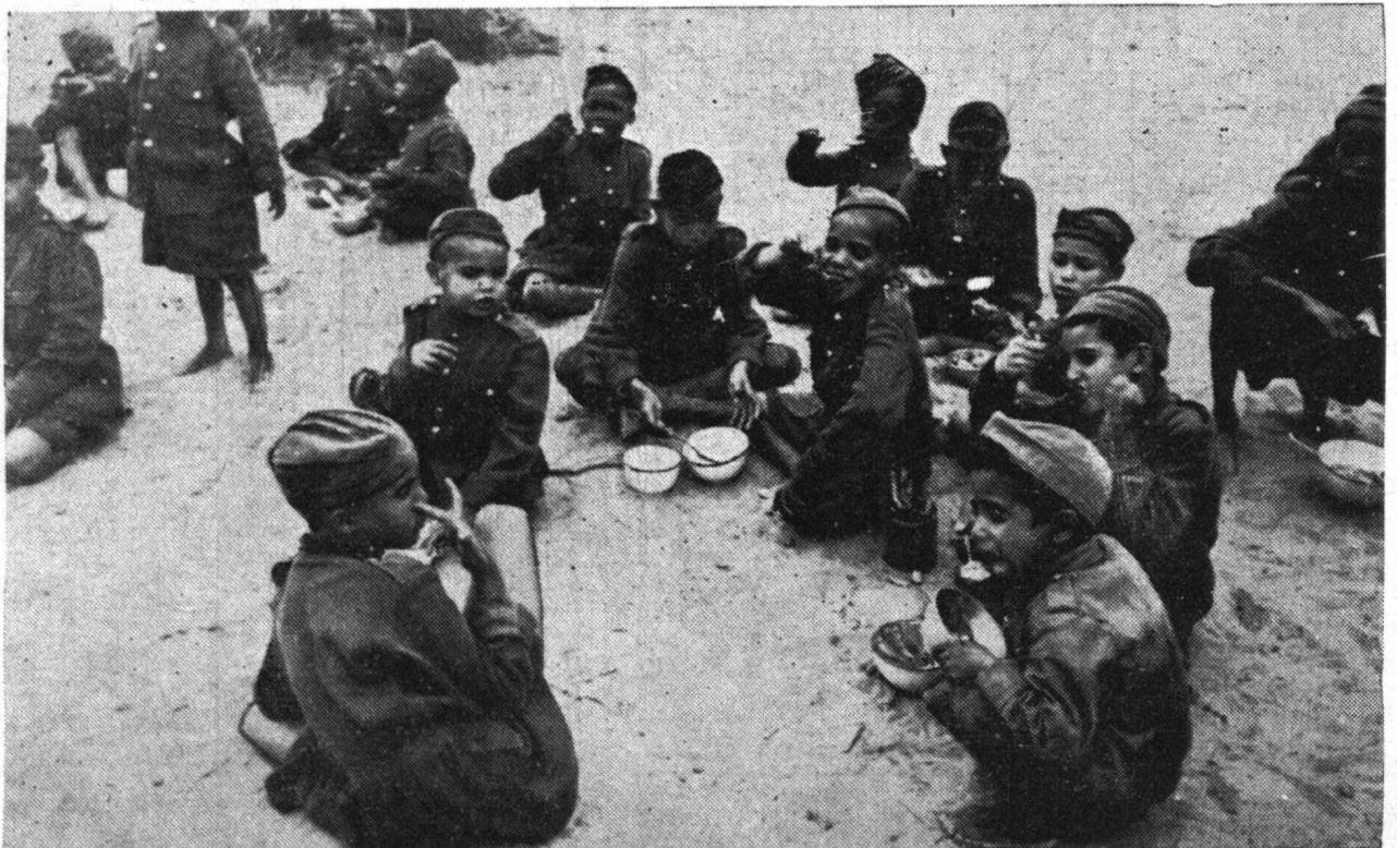
Fig. 5: Les distributions de nourriture exhibées pour attirer les recrutements. La GAL est aussi un espace de survie.