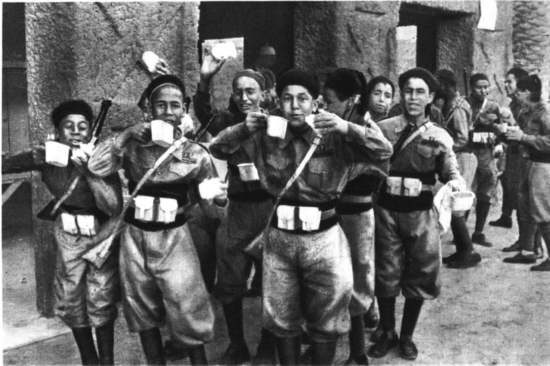
ترويقة شبان ليتوريو العرب