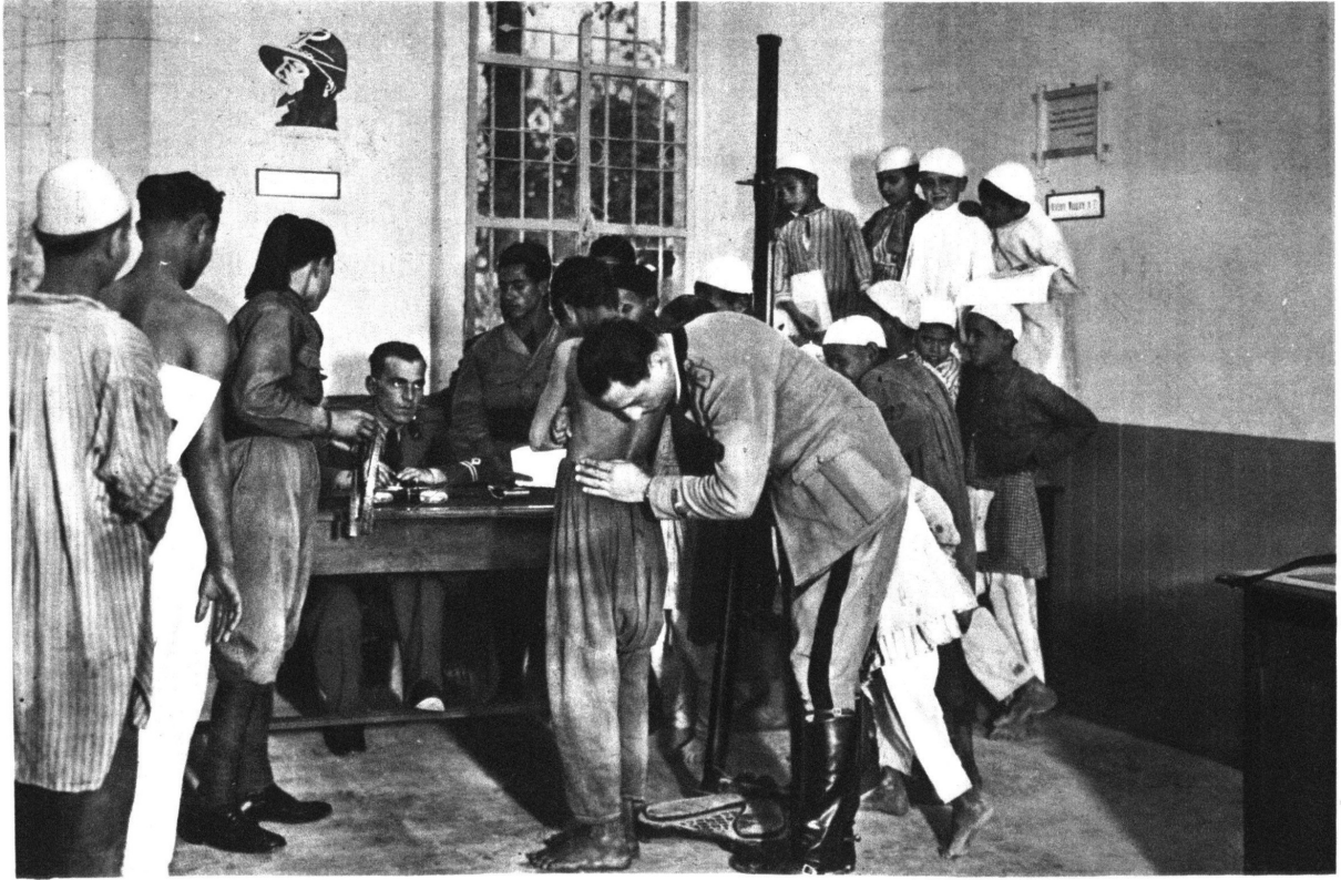
اجراء معاينة طبية دقيقة للتأكد من اهلية الشبان العرب المتقدمين للتطوع في الخدمة