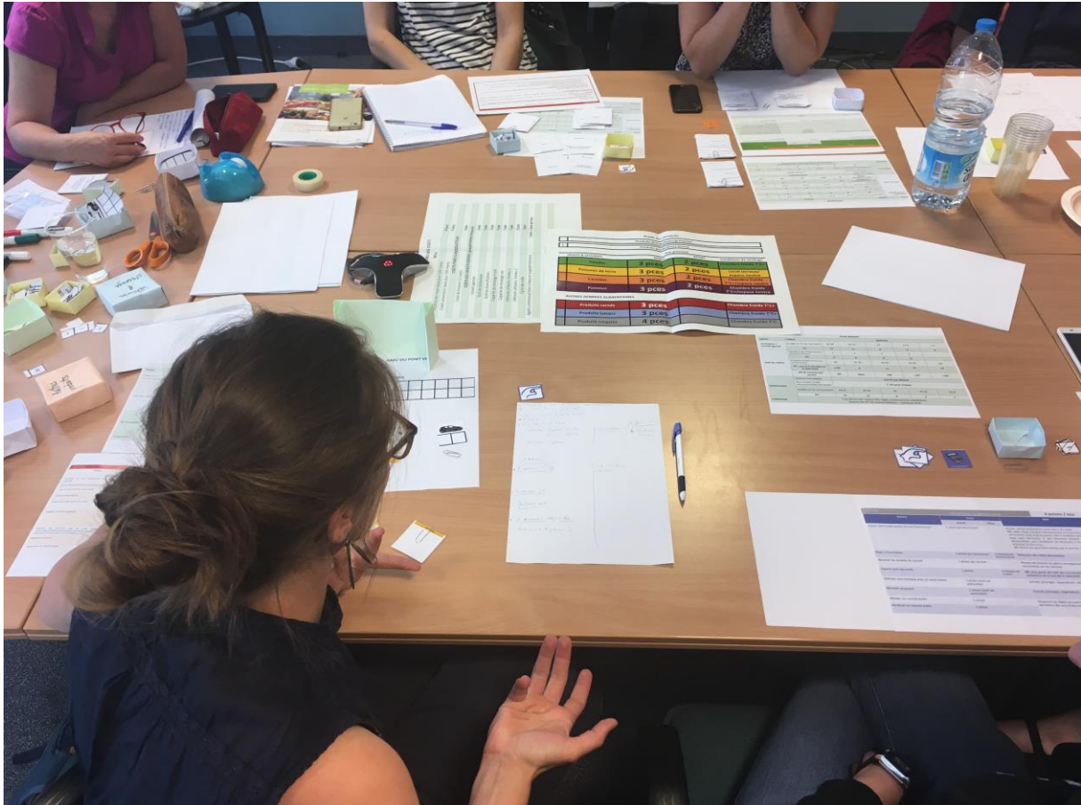
Photo 5 : une vue du matériel de jeu, session du 20 juin 2019 à Lille.

De même, si le matériel est simple d'utilisation, il est composé de nombreuses pièces pour chaque joueur. Des réactions présentant le matériel comme important ont pu être observées au moment de l'installation des joueurs.