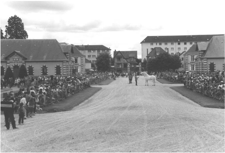
Illustration 2. Les Jeudis du Haras à Saint-Lô