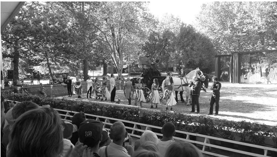
Illustration 1. Spectacle organisé tous les jours de l'été par le Haras de la Vendée

À cette dynamique sportive, s'ajoute la mise en valeur culturelle et touristique du site historique : ouverture gratuite