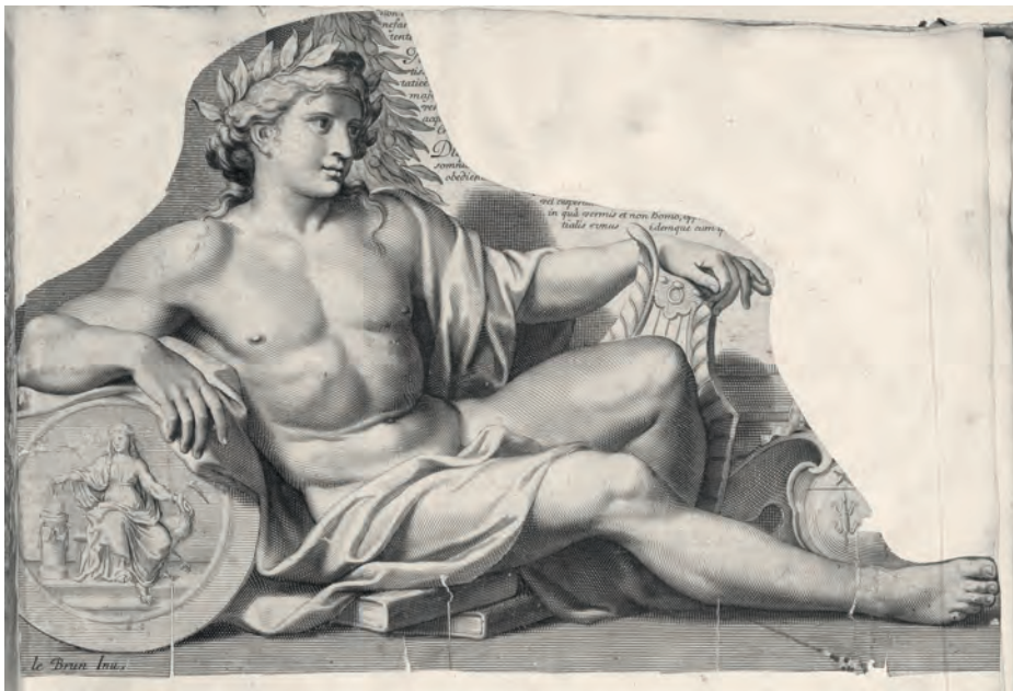
FRANÇOIS DE POILLY da CHARLES LE BRUN, Apollo , acquaforte e bulino, 1663. Torino, GAM, Gabinetto Disegni e Stampe, Album Lavy 101/2003, f. 150r.