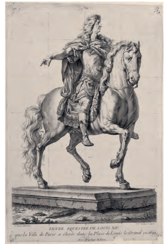
PIERRE-FRANÇOIS TARDIEU da FRANÇOIS GIRARDON, Monumento equestre di Luigi XIV , acquaforte e bulino, 1699 circa. Torino, GAM, Gabinetto Disegni e Stampe, Album Lavy 101/2003, f. 122v.

Alle suites di stampe presentate coerentemen-