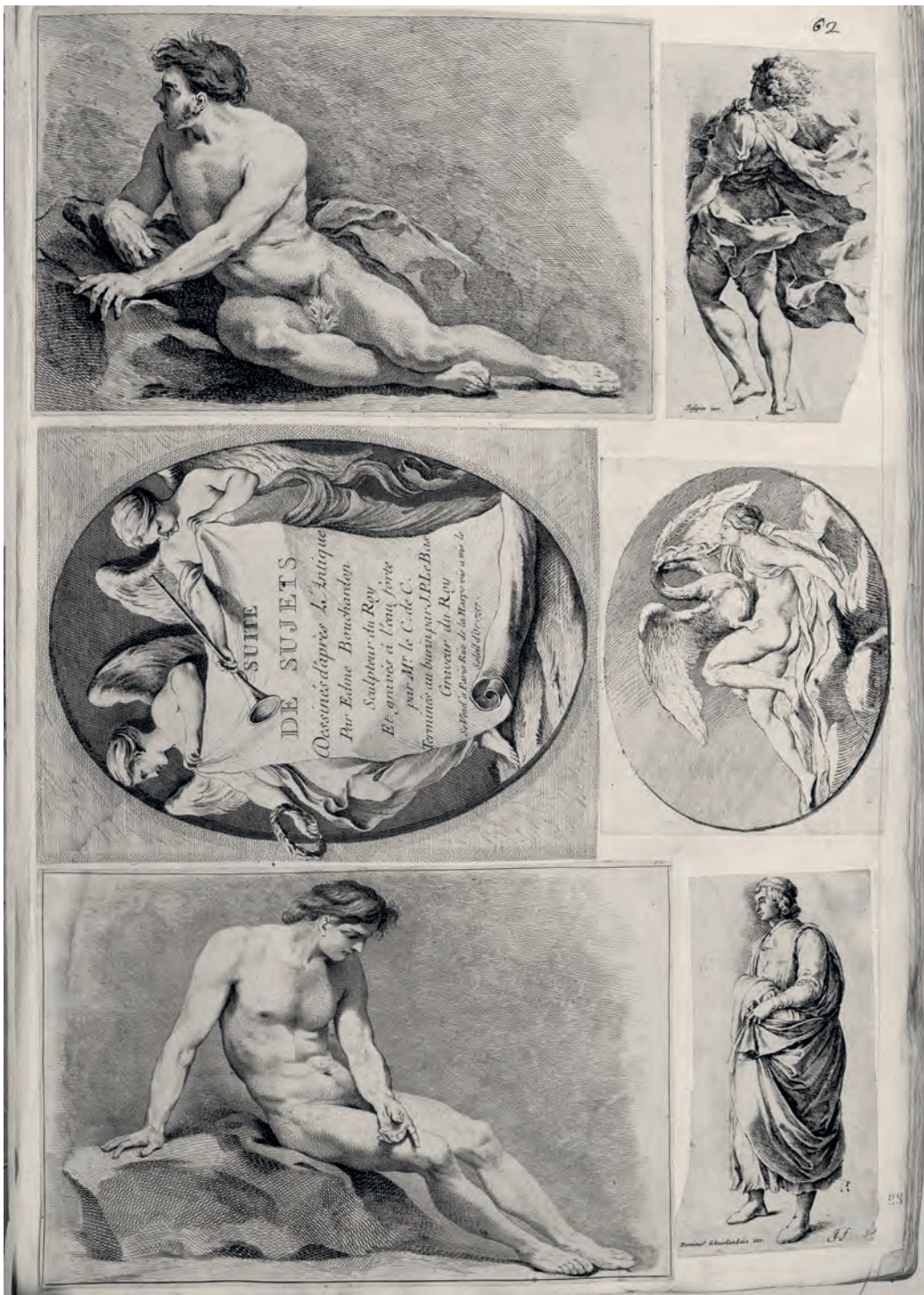
JACQUES-PHILIPPE LE BAS da CARLE VANLOO, Nudi accademici , bulino, 1739; JACQUES-PHILIPPE LE BAS da EDMÉ BOUCHARDON, Disegni dall'antico (Frontespizio, Leda e il cigno ), acquaforte e bulino, 1737; JAN DE BISSCHOP da GIUSEPPE CESARI D'ARPINO e da DOMENICO GHIRLANDAIO, Paradigmata Graphices Variorum Artificum , acquaforte, 1671, Torino, GAM, Album Lavy 101/2003, f. 63r.

affrescate nel 1526-1527 da Polidoro da Caravaggio a Palazzo Milesi, da utilizzare come repertorio di immagini di gusto antiquario 5 . Le incisioni di Briebette 6 rappresentano invece un aggiornamento del fregio antico secondo il linguaggio callottiano: un cielo atmosferico fa da sfondo a cortei formicolanti di sacerdoti e dame romane che si alternano a putti festanti, dando vita a composizioni decisamente più vivaci rispetto alle scene di soggetto storico di Perrier e Galestruzzi.