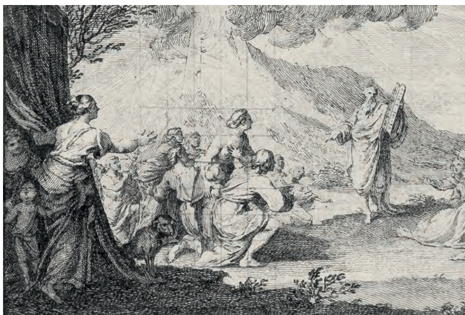
HUBERT-FRANÇOIS GRAVELOT, Mosè con le Tavole della Legge , acquaforte e bulino, particolare, 1733. Torino, GAM, Gabinetto Disegni e Stampe, Album Lavy 101/2003, f. 103v.

Lorenzo Lavy si ispirò ad alcune incisioni contenute nell'album quando, tra il 1757 e il 1773, realizzò i disegni per i conii della Storia metallica della Real Casa Savoia 12 . La figura