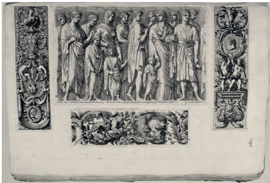
FRANÇOIS PERRIER, Icones et segmenta illustrium dall' Ara Pacis , acquaforte, 1645; JEAN LEPAUTRE, Fregi , acquaforte, 1663 circa. Torino, GAM, Gabinetto Disegni e Stampe, Album Lavy 101/2003, f. 13r.

del rilievo storico romano, che celebra le vittorie militari così come l'esercizio dell'autorità civile e religiosa, dall'altra un gusto ancora tardo-ellenistico nelle rappresentazioni mitologiche di cortei marini 4 . Le tavole di Gailestruzzi riproducono le scene antichizzanti