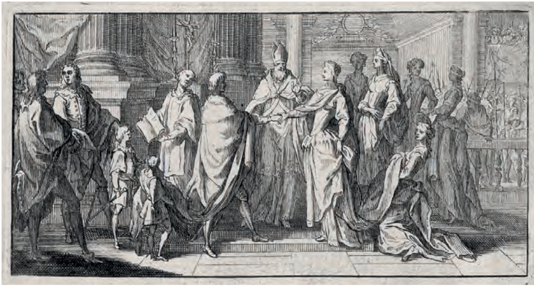
Anonimo, Cerimonia nuziale , prima metà del XVIII secolo. Torino, GAM, Gabinetto Disegni e Stampe, Album Lavy 101/2003, f. 103v.

equestre di Luigi XIV, realizzata da François Girardon nel 1692 e riprodotta nella stampa di Pierre François Tardieu al foglio 122v, è quadrata e servì per il progetto di una medaglia raffigurante un monumento a Carlo Emanuele III collocato sullo sfondo di Piazza San Carlo. Lorenzo guardò ancora ai maestri del secondo Seicento francese quando, nel realizzare il conio celebrativo della conquista della contea di Asti da parte di Carlo III, riprodusse la silhouette dell' Apollo al foglio 150r, particolare del frontespizio della tesi di Charles Maurice Le Tellier, disegnata da Charles Le Brun e incisa da François de Poilly nel 1663. Il medagliata seppe anche reinterpretare l'iconografia di alcune stampe in una logica di celebrazione della casata dei Savoia: è il caso dell'incisione di Mosè con le Tavole della Legge al foglio 103v, eseguita a Londra da Hubert-François Gravelot nel 1733. La posizione e i gesti del gruppo di israeliti sulla sinistra, sui quali si intravedono i segni della quadratura, sono gli stessi dei due deputati che, nel disegno per la medaglia di Caterina di Spagna, presentano le chiavi a Carlo Emanuele I, il quale, con la mano destra aperta e lo sguardo rivolto verso la sua sposa, ripropone la postura di Mosè. Un'altra piccola incisione anonima, disposta accanto alla tavola di Gravelot, fu utilizzata da Lorenzo: la scena frontale con il prelado che benedice i due sposi fu riproposta nella medaglia di Maria di Borgogna, sposa di Amedeo VIII nel 1403.