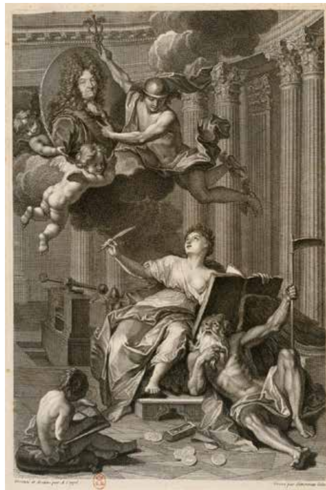
9. Charles-Louis Simonneau d'après Antoine Coyppel, l'Histoire écrivant sur les ailes du Temps les événements du règne de Louis XIV , 1 702 ca., burin, Paris, BnF.

Aucun document concernant la présence de Lavy à Paris ne semble être conservé 22 . Pour essayer de mieux comprendre le type de formation reçue par l'artiste, il est utile d'analyser les témoignages indirects de son séjour français, parmi lesquels on retrouve un recueil d'estampes qui lui appartient, conservé dans le Cabinet des Dessins et des Estampes de la galerie d'Art moderne de Turin 23 . L'album, de dimensions considérables (510 x 360 mm), est composé de cent cinquante-trois pages numérotées sur la partie antérieure, sur lesquelles mille cent une gravures ont été collées. La caractéristique remarquable du recueil réside dans le fait que quatre-vingt-dix pour cent des estampes ont été réalisées par des graveurs français et qu'une bonne partie de cette collection reproduit des œuvres conservées en France ou exécutées par des artistes français en Italie (fig. 8).