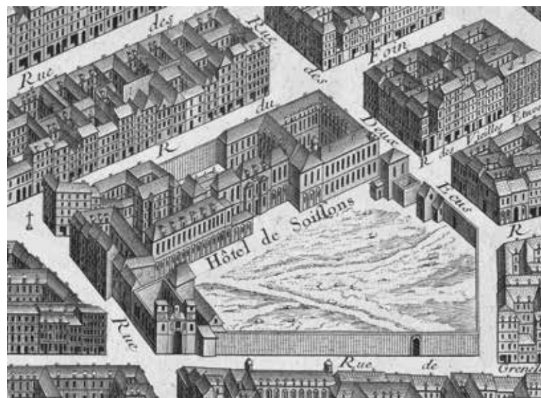
7. Claude Lucas d'après Louis Bretez, Vue de l'Hôtel de Soissons , 1739, burin, plan de Turgot, Paris, BnF.

La vente de la collection de peintures du Carignan est bien documentée par deux catalogues publiés par Nicolas-Jean-Baptiste de Poilly, le