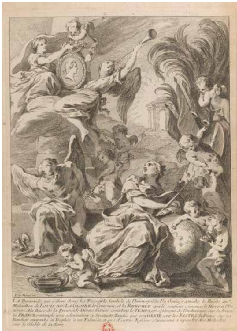
10. Laurent Cars d'après François Lemoine, la France contemple le buste de Louis XV couronné par la Gloire et la Renommée , 1728 ca., eau-forte et burin, Paris, BnF.

La recherche de naturalisme que l'artiste semble poursuivre dans ses dessins nous amène à considérer un sculpteur contemporain, pour lequel le dessin était au cœur de la pratique sculpturale : Edme Bouchardon. Nommé Dessinateur de l'Académie Royale des Inscriptions et Belles-Lettres en 1737, il fut chargé de dessiner les devises des médailles