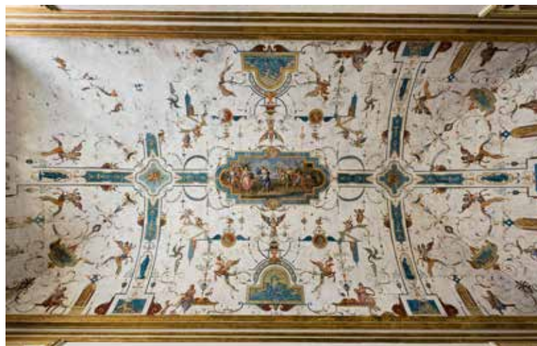
2. Filippo Minei, Grotesques , 1725, fresque, château de Rivoli (Italie), appartement du Roi.