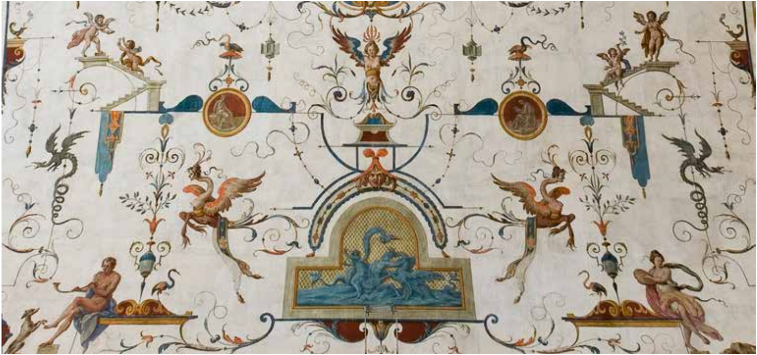
4. Filippo Minci, Grottesques , 1725, fresque, château de Rivoli (Italie), appartement du Roi (détail de la fig. 2).