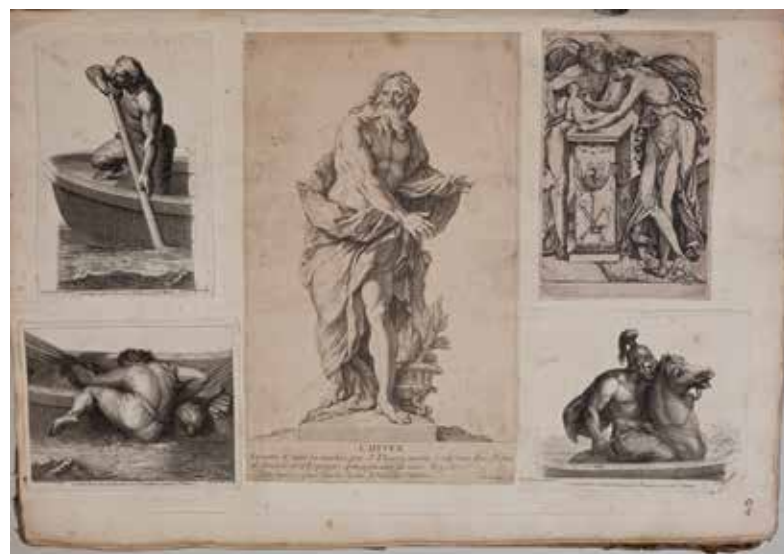
8. Gérard Audran d'après Charles Le Brun, Histoire d'Alexandre , 1672-1678, eau-forte et burin; Charles-Nicolas Cochin d'après Jean Thierry, L'Hiver , 1750 ca., eau-forte et burin; Pierre Biard, Le Génie de la Sculpture , première moitié du XVII e siècle, eau-forte; album Lavy, f° 88r°, GAM Torino.

À partir de 1730, sans doute pour remédier à l'endettement du prince et afin d'augmenter la rentabilité du terrain, la densité des constructions dans les espaces de l'Hôtel de