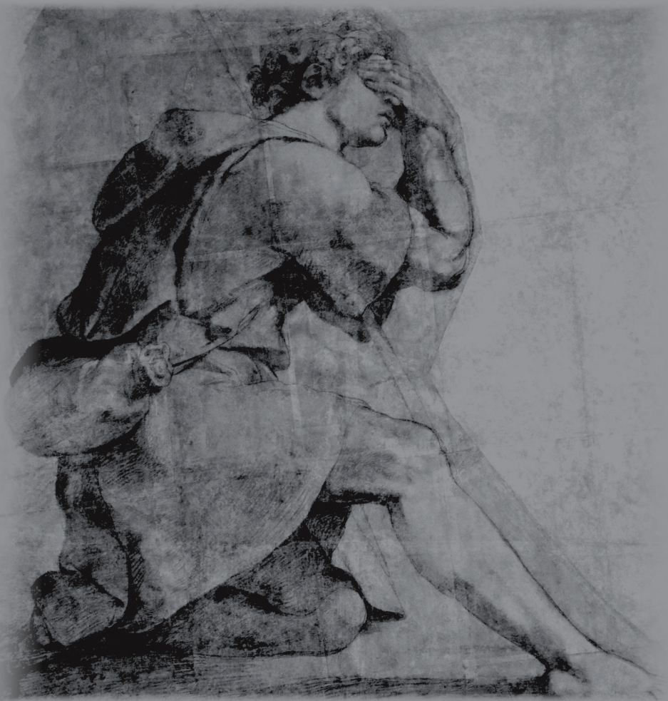
Raphaël, Dessin préparatoire de Moïse au buisson ardent. Naples, Galerie Farnèse (Musée de Capodimonte).