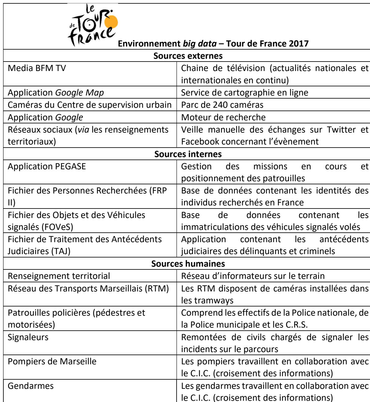
Tableau 1 Environnement big data du superviseur

Au sein du C.I.C., le superviseur croise en continu les différentes informations émanant de son environnement big data . C'est à lui (avec le soutien de ses équipes) que revient la tâche de collecter, de trier, de nettoyer et d'analyser les données disponibles. Certaines technologies génèrent des flux d'information difficilement traitables manuellement : le superviseur se trouve par exemple face à quatre écrans retranscrivant jusqu'à 16 flux vidéo simultanément. Il doit donc être capable d'identifier très rapidement les informations présentant un intérêt par rapport à la situation qu'il rencontre.