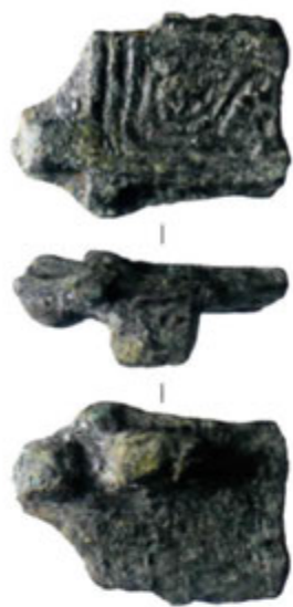
Fig. 129 - Plaque-boucle byzantine en cours de fabrication provenant de l'établissement antique à occupation longue de Saint-Martin-de-Grézan (Pouzolles) Échelle 1

Parmi les sites antiques à occupation longue qui livrent du mobilier du VI e s. de n. è., l'établissement de Saint-Martin de Grézan (Pouzolles) se distingue en fournissant une documentation abondante.