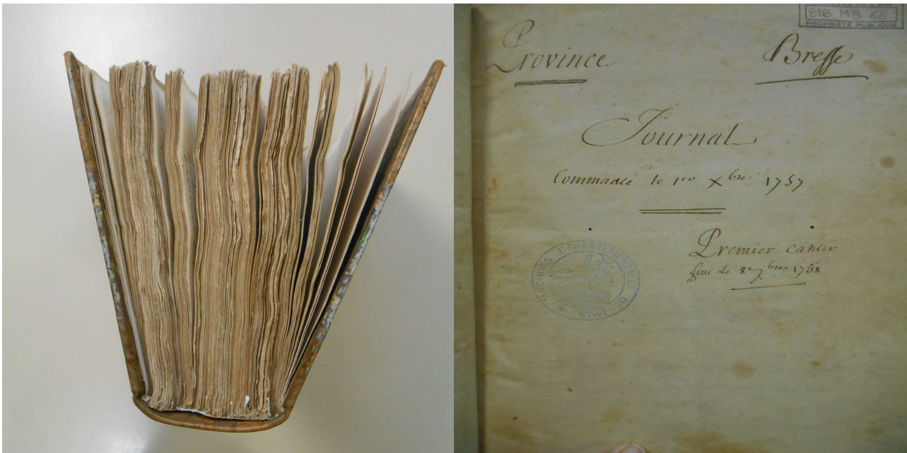
Archives départementales de l'Ain, BIB Ms 66 Photographies A. Levasseur

Derrière la cote BIB Ms 66 des Archives départementales de l'Ain se trouve un manuscrit de 1048 pages, connu sous le titre de Journal de Vincent 10 . Ce manuscrit, en excellent état, est composé de multiples cahiers dont les pages de garde ont été retirées (à l'exception de la première et de la dixième) pour former un ensemble uniforme. Le tout a été récemment relié en mi-cuir par le service d'archive.