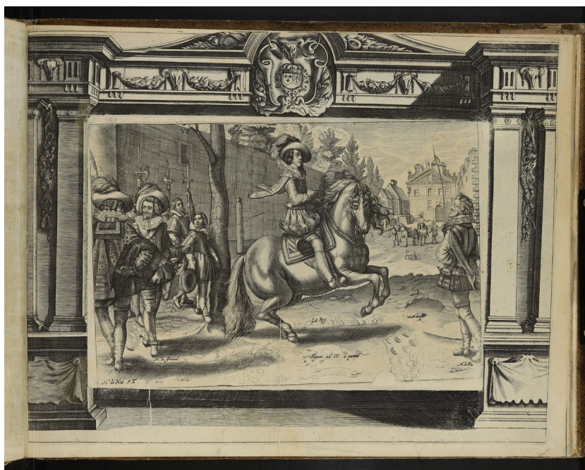
Ill. 1 4

Chaque cheval avait son caractère individuel avec des faiblesses et des qualités. Il était important de préserver la joie de l'équitation pour le cheval parce qu'un cheval apathique et anxieux ne rayonnait pas de sa grâce naturelle. La différence entre un bon cavalier et un cavalier qui se tient simplement bien en selle était que le premier ne s'intéressait pas seulement à l'enseignement de l'équitation mais aussi à son cheval et faisait l'effort de le comprendre. Avec cette théorie, Pluvinel se rattache à Xénophone (425 av. J.-C. - 354 av. J.-C.) 3 .