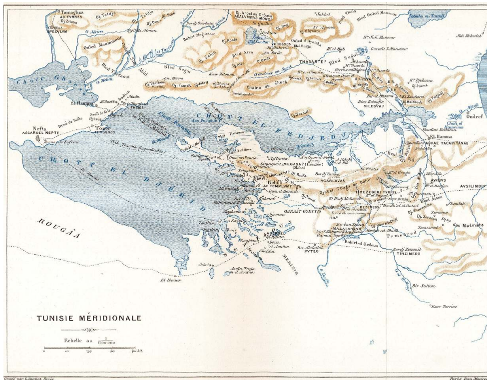
Figure 2 : Carte des bassins du Chott el Djerid et du Chott el Gharsa par Charles Tissot (voyages de 1853 et 1857)

Source : Charles Tissot (1883), planche xx ; échelle au 1/800 000.