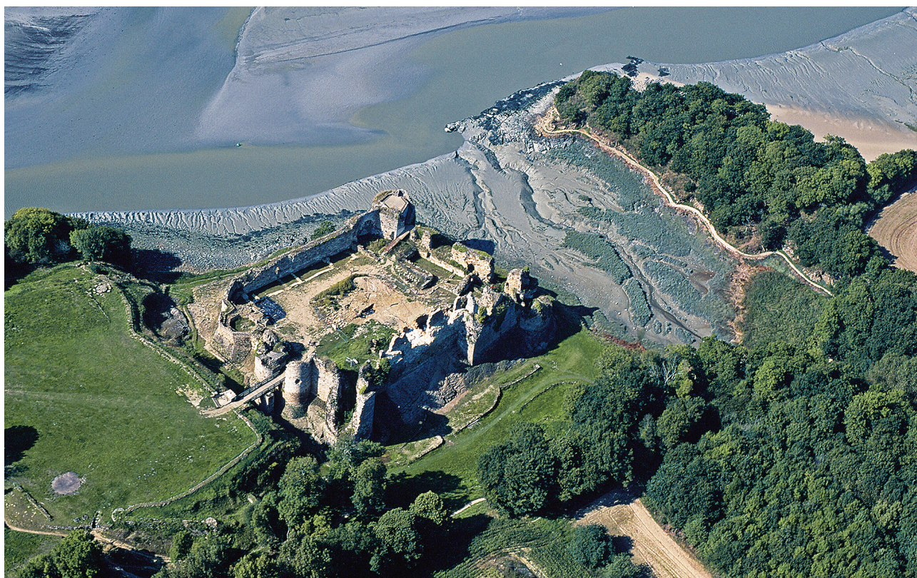
Fig. 1 - Créhen, château du Guildo, vue aérienne du site.

Le château, réparé à la hâte, sera à nouveau endommagé par plusieurs sièges durant les guerres de Religion, puis à nouveau réparé. Il sera finalement abandonné avant la Révolution Française et servira de carrière.