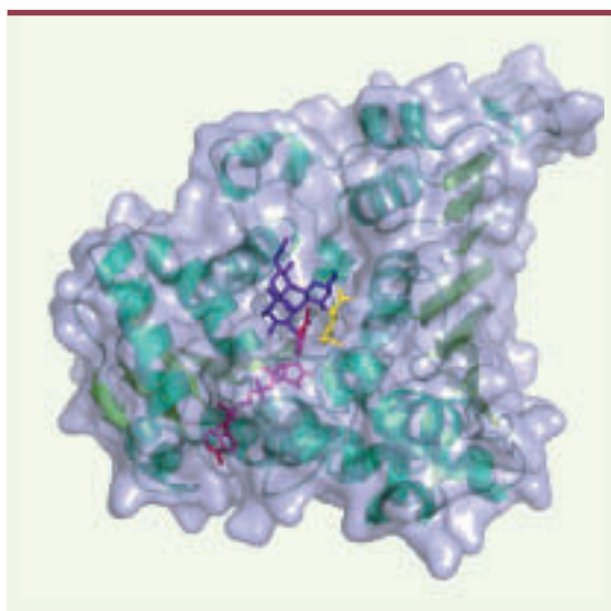
Figure 2. Vue générale de la structure moléculaire de l' \alpha -N-acétylgalactosaminidase d' Elizabethkingia meningosepticum (vert) sous surface transparente (bleu clair) en complexe avec le cofacteur NAD + (magenta) et l'antigène A (violet), présent à la surface des globules rouges du type A. La molécule d' \alpha -N-acétylgalactosamine, qui est reconnue et hydrolysée par l'enzyme, est colorée en jaune.