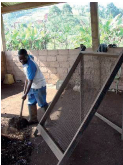
Figure 4 : Tamisage par trommel à Mahajanga (haut) et manuel sur plan incliné à Dschang (bas)