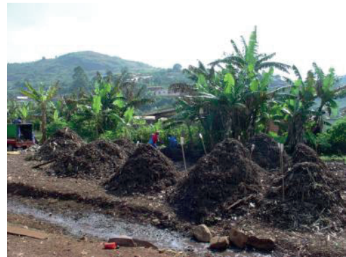
Figure 3 : Tas de déchets dans l'étape dite de fermentation chaude à Dschang