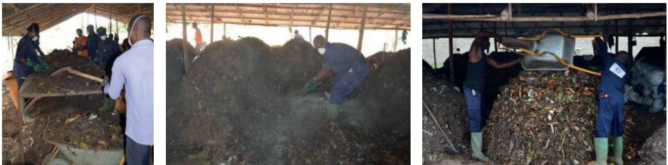
Figure 2 : Vue d'une opération de tri (à gauche), de mise en andains (milieu) et de retournement (à droite) sur la plateforme de compostage de Lomé

De plus, l'absence de tri induit la présence de déchets dangereux du début du procédé jusqu'à l'étape de tamisage avec pour conséquences possibles l'augmentation du risque sanitaire pour les travailleurs et la diminution de la qualité du compost :