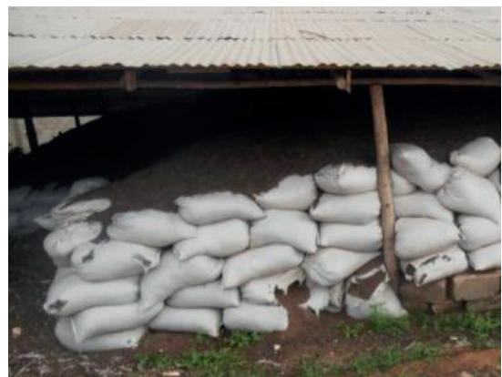
Figure 5 : stockage du compost à Lomé

Le stockage et la vente du compost peuvent se faire en vrac ou en sac. La vente en vrac permet de diminuer les coûts mais nécessite d'adapter la commercialisation en conséquence.