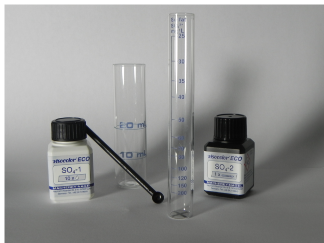
Figure 1 : Kit Visocolor® pour l'analyse des sulfates en solution

Le kit Visocolor® exploite la turbidité du précipité créé par le sulfate en présence de chlorure de baryum pour déterminer la concentration en sulfate en solution. Cette réaction se fait en milieu