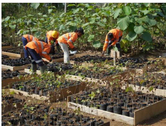
Photo 3 : Une vue de la pépinière créée et entretenue par les Relais

Après avoir donné leur accord pour la création de la réserve, la Société minière a procédé au dédommagement des propriétaires terriens et s'est engagée aussi dans la sensibilisation de toutes les populations riveraines. Elle a informé et sensibilisé les Autorités administratives départementales et préfectorales, ainsi que la police forestière, sur la création et l'existence de la réserve (Photo 4). Les Responsables de la Police forestière (Eaux et Forêts) et de la Société de Développement des Forêts, structures étatiques en charge de la gestion des forêts rurales, ont été associées pour entreprendre les démarches finales en vue d'obtenir un statut légal définitif à la réserve forestière Dékpa.