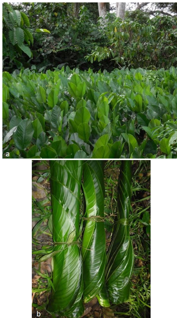
Photo 5 : Vues de peuplement de Thaumatococcus daniellii (a) et des tas de feuilles de l'espèce (b)

manioc, à forte valeur économique et très prisée par les ivoiriens. Cette espèce abonde dans les espaces anciennement cultivés de la réserve (Photo 5).