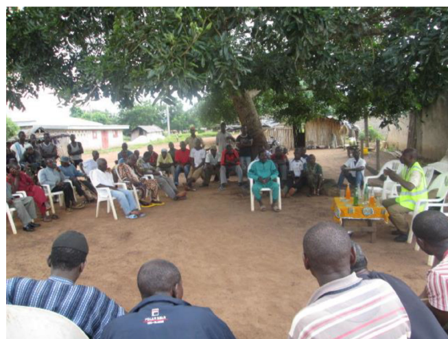
Photo 1 : Une séance de réunion d'information avec les populations du village de Douaville

Le troisième groupe d'activités concerne l'inventaire complet de la flore initiale de la réserve. Pour y parvenir, 35 parcelles de 200 m 2 ont été aléatoirement mises en place dans des espaces abandonnés (10 parcelles) et des espaces moins dégradés (25 parcelles) appartenant à la réserve forestière. Dans ces parcelles, la présence de toutes les espèces végétales a été notée. Les circonférences des individus d'espèces arborescentes ayant un dbh \geq 5 cm, ont été mesurées. Les espèces à statut scientifique et écologique particulier ont été identifiées.