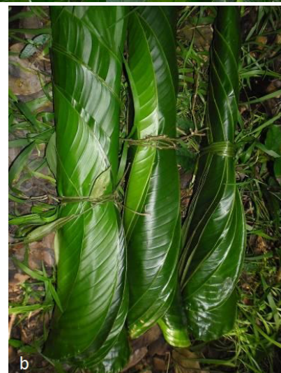
Photo 5 : Vues de peuplement de Thaumatococcus daniellii (a) et des tas de feuilles de l'espèce (b)