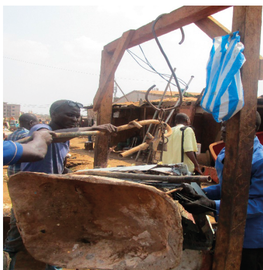
Figure 1. Pesage et vente de ferraille dans un point de transfert à Yaoundé

Cependant, ces prix ne sont pas fixés par l'État mais « homologués » par les opérateurs en aval de la chaîne à savoir les entreprises de RI. Mais dans un contexte social où prévaut le chômage, c'est moins que rien. On comprend donc que ces prix ne peuvent en aucun cas satisfaire les opérateurs en amont de la chaîne à savoir les collecteurs. De plus, d'après les livreurs de la ferraille dans les entreprises de RI, la marchandise une fois livrée, on est payé partiellement. Il faut attendre au moins trois mois pour espérer percevoir la totalité de son argent. Ce qui crée un énorme préjudice pour la stabilité de l'activité des opérateurs intervenant à ce niveau.