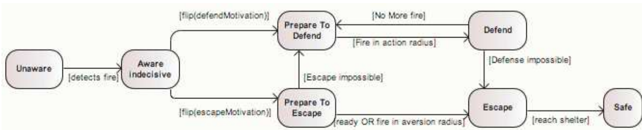
FIGURE 1 – Automate de comportement des habitants. Les transitions vers les états Survivant (santé positive en fin de simulation) et Mort (santé nulle) peuvent se faire depuis n’importe quel état et ne sont pas montrées par souci de simplicité.

Lazarus [10] concernant l’évaluation cognitive et le stress.