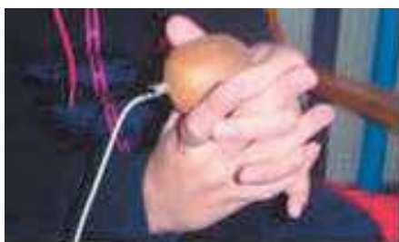
Fig. 4. Utilisation d'un fruit connecté dans le scénario « diversification alimentaire ».

Le premier scénario impliquait cinq enfants déficients visuels de 12 à 18 ans avec des troubles du comportement et des troubles envahissants du développement. Ce scénario visait à encourager les enfants à manger différents fruits qui sont souvent jugés comme désagréables au toucher (par exemple, l'orange ou le kiwi). A partir du « Makey Makey » et du logiciel de programmation « Scratch », les fruits ont été connectés à une chanson que chaque enfant aimait bien. L'éducateur a insisté sur la nécessité de jouer et arrêter précisément le morceau lorsque les enfants touchaient et relâchaient le fruit. Lors de l'activité, nous avons observé que le prototype suscitait une grande curiosité de la part des enfants, et qu'ils touchaient des fruits qu'ils refusaient de toucher auparavant. La Figure 3 présente une partie du prototype dans les mains d'un des enfants.