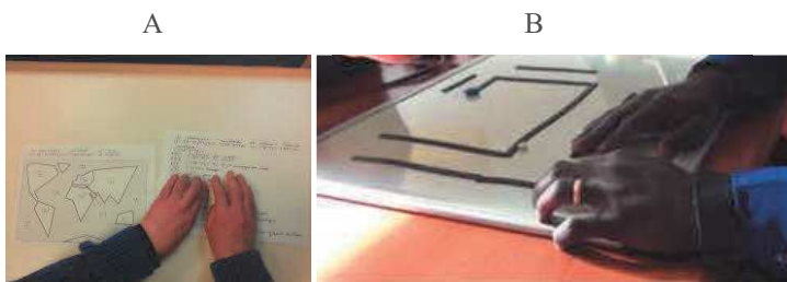
Fig. 2. A. Exemple d'une carte en relief thermogonflée représentant les différents continents du monde. Les légendes prennent beaucoup de place et doivent être affichées sur un autre document. B. Utilisation du tableau aimanté pour représenter un quartier lors d'une séance collaborative (élève, enseignant) de formation en locomotion