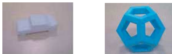
Fig. 3. Exemples d'objets imprimés en 3D présentés lors des sessions de conception participative.

Afin de montrer la potentialité des outils de prototypage rapide, nous avons organisé deux sessions de conception participative avec les professionnels et les enfants du centre au cours desquelles des objets 3D, imprimés ou non, (papillon, voiture, polygone, Tour Eiffel, et fruits), ainsi que des cartes microcontrôleurs (« Makey Makey » et « Touch Board ») étaient présentés [15]. La figure 2 présente deux exemples d'objets imprimés en 3D présentés lors de ces sessions.