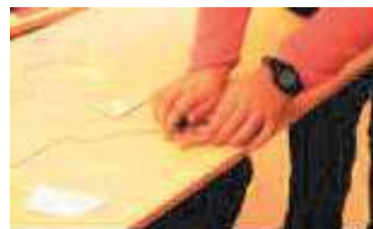
Fig. 6. Formes géométriques connectées lors d'une séance de mathématiques.

Le troisième scénario était basé sur une leçon de géométrie avec des enfants déficients visuels de 16 à 18 ans atteints de troubles d'apprentissage et de troubles du comportement mineurs. Différentes parties des formes géométriques (tels que les côtés et les angles) ont été rendues interactives avec une « Touch Board » et le logiciel de programmation « Arduino ». Lorsque les élèves touchaient ces parties, des descriptions verbales sur la valeur de l'angle, la longueur ou la largeur, étaient déclenchées. Dans ce scénario, l'enseignant a observé une bien meilleure participation des élèves lors de la résolution d'un problème géométrique. La Figure 5 présente un élève en train d'utiliser le prototype lors de la résolution du problème géométrique.