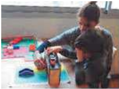
Fig. 7. Modèle physique connecté d'un quartier lors d'une séance d'apprentissage à la locomotion.

thermogonflée. Une « Touch Board » et le logiciel de programmation « Arduino » ont été utilisés pour créer les zones interactives qui déclenchaient des sons enregistrés par l'enfant lors d'une promenade préparatoire dans ce quartier. Deux types de sons avaient été enregistrés : le son d'un train qui passe sur le pont et le son de pierres jetées par l'enfant dans le canal (ce qu'il faisait systématiquement quand il traversait le pont). L'enfant avait également à disposition un train miniature et une figurine. Ainsi, lorsque le train touchait le pont en bois, le son du train qui passe était joué. Lorsque la figurine touchait le pont pédestre, le son des chutes de pierres dans l'eau était joué. L'enfant s'est montré particulièrement curieux et assidu au cours de la session avec le dispositif. De son côté, l'institutrice était vraiment satisfaite par le prototype, et a considéré le prototype comme un outil efficace pour aider cet élève en particulier, mais aussi les élèves déficients visuels en général, à comprendre un quartier difficile. La Figure 6 présente l'institutrice de locomotion et l'élève en pleine session d'apprentissage de la configuration du quartier avec le prototype.