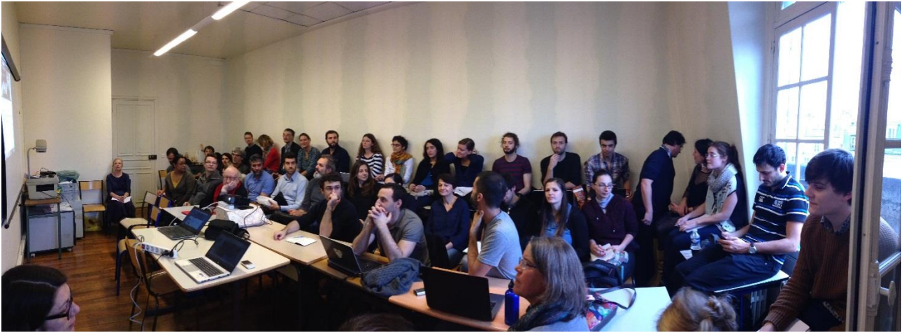
Figure 3 : Une réunion de l'équipe P.A.R.I.S. rue du Four en décembre 2015