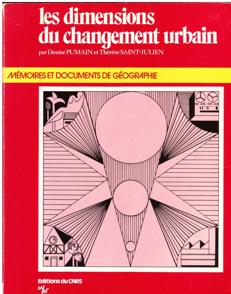
Figure 1 : Les dimensions du changement urbain, D. Pumain et Th. Saint-Julien, Paris, Editions du CNRS, 1978