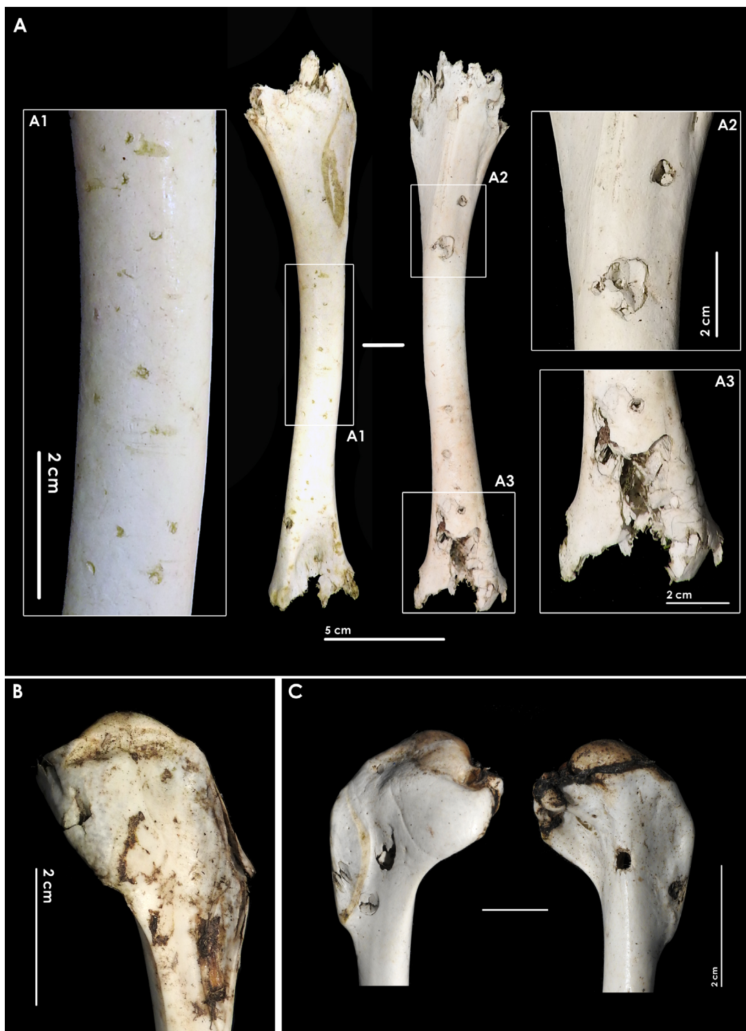
Figura 2. Depresiones y perforaciones observadas sobre el húmero izquierdo de buitre leonado (A), un húmero izquierdo de milano (B) y el húmero derecho de cuervo (C). El húmero de buitre presenta mordisqueo intenso en las zonas articulares.