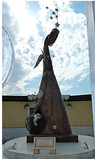
Figure 5. Derrière une grille et séparée des tombes par un mur, la sculpture sur la fosse commune du cimetière général de la capitale, mai 2011.

réaliser sans l'aide internationale (Beckett, 2017). Les autres entreprises commémoratives qui furent matérialisées dans l'espace ont été financées et organisées par des organismes d'aide internationaux ou sur initiative privée 5 , car l'Etat n'avait pas les moyens de les réaliser. Par exemple, au-dessus de la fosse commune du cimetière général de Port-au-Prince, une sculpture de l'artiste Lionel Saint-Eloi, figurant une femme qui pleure, fut érigée. Inaugurée en 2011 par le maire de la capitale, entourée de grilles pour préserver l'espace, elle a été financée par l'USAID (figure 5).