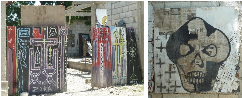
Figures 10 et 11. Représentations de la mort à travers des symboles vodous, agglomération port-au-princienne, septembre 2012.

En effet, le séisme de 2010 est partout : il est rappelé dans le paysage urbain par les reconstructions lentes et les décombres encore visibles, par les camps ou bidonvilles dans lesquels les déplacés se sont installés et demeurent toujours, par les fosses communes éparses que les initiés savent identifier. Il est rappelé dans les corps, pour ceux qui ont été blessés, et dans les âmes, pour tous ceux qui ont vécu la catastrophe ou sont affectés par la disparition de proches. Il est rappelé dans la convocation permanente du monde de l'au-delà, par des rencontres avec la mort, que ce soit dans un cimetière, lors de cérémonies, ou dans sa vie quotidienne ; mais aussi dans les pratiques artistiques, qui s'expriment souvent sur les murs et sont couramment inspirées par les loas (figures 10 et 11 ; Cosentino, 1995). Il est rappelé par la dislocation de l'Etat, la précarité grandissante, les religions comme palliatifs à l'union nationale. Le séisme a donc laissé beaucoup de traces, qui sont des indices non intentionnels du passés, des vestiges qui peuvent disparaître ou être éventuellement patrimonialisés (Veschambre, 2008). Par contre les marques, qui sont construites à partir de ces traces par un acteur social, sont peu présentes, issues d'initiatives privées ou associatives, et délaissées par l'Etat. L'absence de mémorial national, tel celui de Titanyen, renvoi à une carence de liens de confiance, de considération, et de redevabilité entre la population et l'Etat.