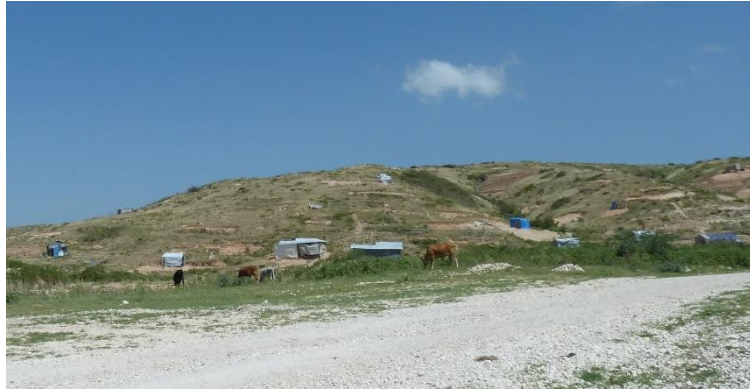
Figure 9. Autour des fosses communes de Titanyen, au premier plan, le nouveau quartier / bidonville de Canaan s'est déployé au fil des années, comme en témoigne cette photo des premiers temps de l'installation. Septembre 2012.