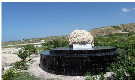
Figure 6. Le site des fosses communes de Titanyen – Morne Saint Christophe, septembre 2012.

Le 12 janvier 2012, l'ancien dictateur Jean-Claude Duvalier, rentré l'année précédente après 25 ans d'exil, s'imposa à la cérémonie officielle de Titanyen en présence de Bill Clinton, de diplomates, et de tous les membres du gouvernement. Les journalistes furent repoussés par les autorités et il existe peu d'images de cette cohabitation. En effet, la présence d'un personnage décrié, notamment par les acteurs pro-démocratie et de la solidarité internationale qui assistaient à la cérémonie, donnait une vision négative de l'unité qui devait être de mise à ce moment, sans compter le préjudice d'image pour les personnalités internationales importantes comme Bill Clinton, qui s'efforça de ne pas s'approcher trop près de l'encombrant ex-dictateur. Sur l'estrade où se déroulaient les habituels discours, chants (dont l'hymne national), sonneries aux morts, dépôt de fleurs, le paysage avait peu changé par rapport à l'année passée. Martelly promit la construction d'un mémorial national à Titanyen (figures 7 et 8).