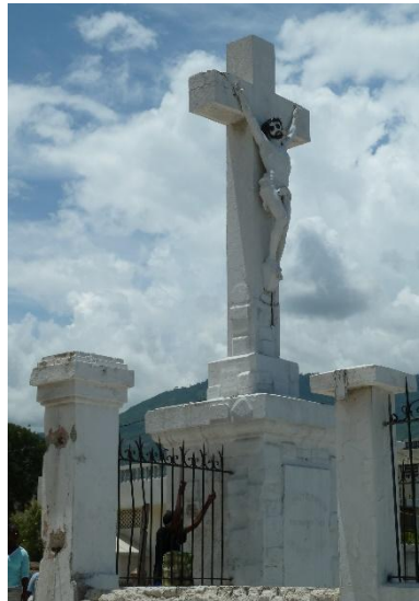
Figure 1. Seule la croix devant la cathédrale écroulée est restée debout, au centre de Port-au-Prince : des prières de tous les cultes (chrétiens comme vodou) s'y déroulent en continu en avril 2011.

lieu à une muséification importante et localisée sur plusieurs sites. Les dispositifs mémoriels vont des visites des ruines en état d'une ville dévastée à la présence de multiples musées, publics et privés. Ils expliquent les causes naturelles du tremblement de terre tout en valorisant la puissance de la Nation (peuple et Etat) à venir secourir les victimes et leur résilience à « se relever » (Le Mentec, Qiaoyun, 2017). Si, à priori, les formes mémorielles des catastrophes naturelles prennent moins celles d'une leçon d'histoire, et sont donc moins inclinées à des enjeux d'instrumentalisation identitaire (Bouton, 2014), le cas de Wenchuan rappelle que toute mise en musée, ou tout processus mémorial, est forcément issu de choix, et peut incarner un élément important d'un discours politique (Hartog, Revel 2001).