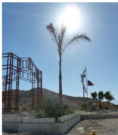
Figures 7 et 8. Fin 2015, un panneau signale le site, où le mémorial est lentement érigé.

En 2018 et en 2019, un gardien fut nommé à Titanyen. N'ayant pas les moyens d'entretenir les lieux (par exemple pour arroser les plantations ou exécuter les petites réparations), il essayait de préserver le site des vols tout en accompagnant les quelques visiteurs (diaspora, personnels des ONG) contre rémunération. Le mémorial avec portail, entrée centrale, gravillons blancs, sculptures en fer forgé, poèmes gravés sur des plaques de céramique, armature de fer autour de la pierre centrale et drapeau, se construisait lentement et prenait progressivement une forme mémorielle avec des codes architecturaux et paysagés plus conformes à ce que beaucoup de visiteurs internationaux pouvaient attendre d'un lieu de mémoire. Comme si les morts du séisme, qui avaient d'abord été exposés sur les télévisions du monde entier, provoquant l'avalanche de solidarité internationale pour le « sauvetage » puis la « reconstruction » du pays, devaient retourner dans ce giron mondialisé de la mémoire de la catastrophe par le biais de structures et de commémorations typiques, universellement compréhensibles, caractéristiques des sociétés contemporaines et de leur approche du passé (Traverso, 2005).