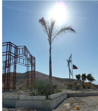
Figures 7 et 8. Fin 2015, un panneau signale le site, où le mémorial est lentement érigé.

En 2018 et en 2019, un gardien fut nommé à Titanyen. N'ayant pas les moyens d'entretenir les lieux (par exemple pour arroser les plantations ou exécuter les petites réparations), il essayait de préserver le site des vols tout en accompagnant les quelques visiteurs (diaspora, personnels des ONG) contre rémunération. Le mémorial avec portail, entrée centrale, gravillons blancs, sculptures en fer forgé, poèmes gravés sur des plaques de céramique, armature de fer autour de la pierre centrale et drapeau, se construisait lentement et prenait progressivement une forme mémorielle avec des codes architecturaux et paysagés plus conformes à ce que beaucoup de visiteurs internationaux pouvaient attendre d'un lieu de mémoire. Comme si les morts du séisme, qui avaient d'abord été exposés sur les télévisions du monde entier, provoquant l'avalanche de solidarité internationale pour le « sauvetage » puis la « reconstruction » du pays, devaient retourner dans ce giron mondialisé de la mémoire de la catastrophe par le biais de structures et de commémorations typiques, universellement compréhensibles, caractéristiques des sociétés contemporaines et de leur approche du passé (Traverso, 2005).