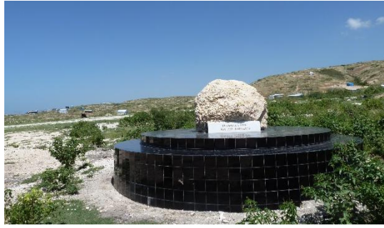
Figure 6. Le site des fosses communes de Titanyen – Morne Saint Christophe, septembre 2012.

Le 12 janvier 2012, l'ancien dictateur Jean-Claude Duvalier, rentré l'année précédente après 25 ans d'exil, s'imposa à la cérémonie officielle de Titanyen en présence de Bill Clinton, de diplomates, et de tous les membres du gouvernement. Les journalistes furent repoussés par les autorités et il existe peu d'images de cette cohabitation. En effet, la présence d'un personnage décrié, notamment par les acteurs pro-démocratie et de la solidarité internationale qui assistaient à la cérémonie, donnait une vision négative de l'unité qui devait être de mise à ce moment, sans compter le préjudice d'image pour les personnalités internationales importantes comme Bill Clinton, qui s'efforça de ne pas s'approcher trop près de l'encombrant ex-dictateur. Sur l'estrade où se déroulaient les habituels discours, chants (dont l'hymne national), sonneries aux morts, dépôt de fleurs, le paysage avait peu changé par rapport à l'année passée. Martelly promit la construction d'un mémorial national à Titanyen (figures 7 et 8).