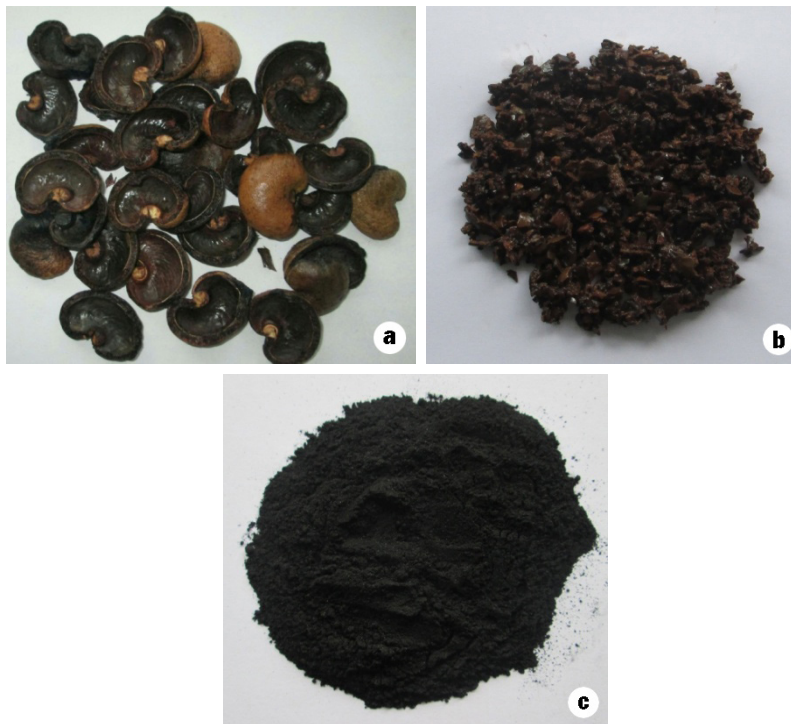
Figure 1. Photos de Coques de noix d'anacarde CNA brutes (1a, fraction : 2,5-3,5cm.) et broyées (1b : fraction 3-6 mm) ainsi que du charbon actif préparé par traitement de cette ressource (1c)

traitement d'activation : 400, 600 et 700°C. Au total, trois CAs ont donc été obtenus, référencés CA400, CA600 et CA700 correspondant respectivement aux températures d'activation 400, 600 et 700°C.