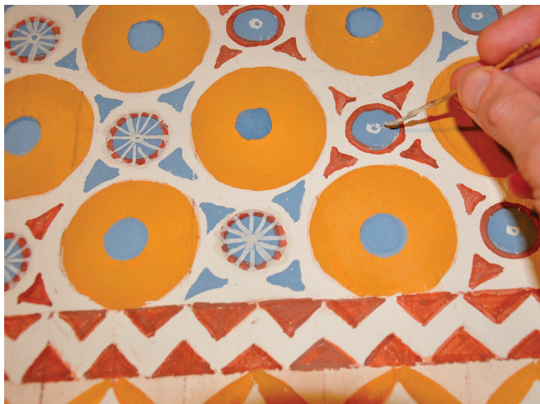
Fig. 8. Reconstitution à échelle réelle d'un thème décoratif de plafond. Un fin pinceau fabriqué à partir d'une tige de régime de dattes est utilisé pour peindre les détails (cl. H. Tavier).