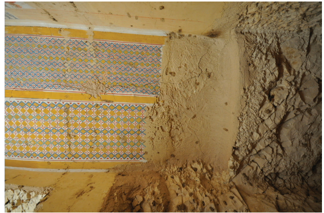
Fig. 4. Les travaux subitement interrompus dans la TT 367 montrent que le découpage du rocher, l'enduisage du plafond et sa décoration étaient exécutés en phases rapprochées.