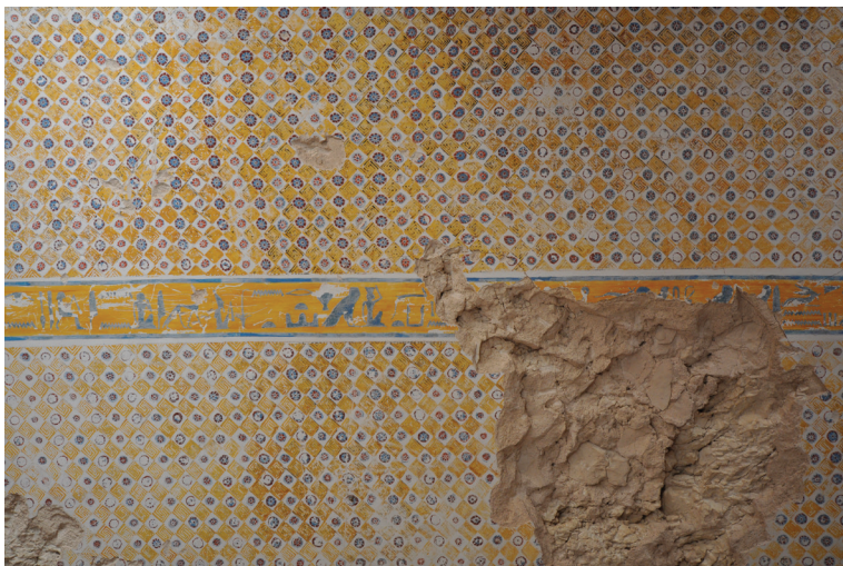
Fig. 2. Vue partielle du plafond de la salle large de la TT 81 (cl. H. Tavier).

pillages systématiques et de profanations. Les plafonds peints ont majoritairement échappé aux exactions des occupants. Ils représentent au moins quatre-vingts pour cent de la surface totale des peintures conservées. Pourtant, ils sont peu étudiés en raison de leur programme strictement décoratif et répétitif (fig. 1 et 2). Nous nous limiterons ici aux plafonds des chapelles funéraires réalisées durant la XVIII e dynastie et plus particulièrement entre les règnes de Ahmose et de Toutankhamon (c. 1550-1320 a.C.). Les quelques publications dédiées à ces décors sont essentiellement des relevés typologiques qui ne font aucun cas des procédés d'élaboration des motifs 3 . Or, ce sont eux qu'il faut traquer