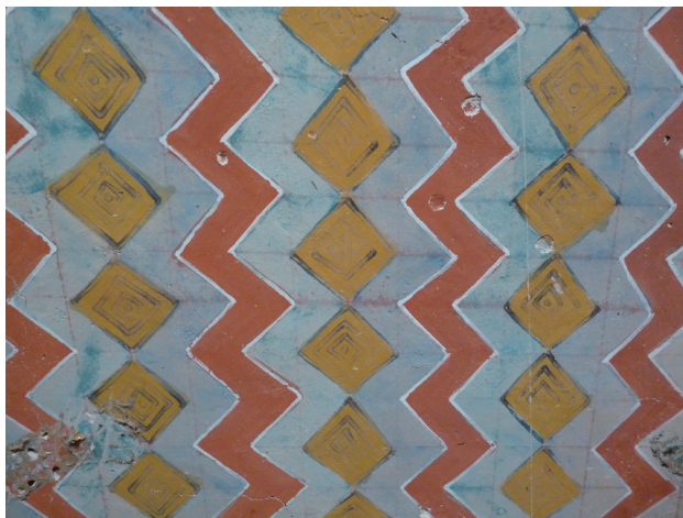
Fig. 3. Décor en chevrons et losanges dans la TT 101. L'altération des couches picturales permet d'observer le quadrillage préparatoire.

Dans plusieurs tombes inachevées on voit des plafonds dont la réalisation fut interrompue subitement (ex. les TT 66, TT 74, TT 75, TT 76, TT 101, TT 367). Des grilles sont en place sur l'enduit, tracées à la corde trempée dans un bain d'ocre rouge puis claquée. Des segments de décors plus ou moins aboutis, selon les cas, montrent comment leurs motifs étaient conçus et peints ; alors que lorsque les décors des plafonds sont complets, le processus de leur mise en place a disparu masqué par la couleur souvent épaisse. Une observation minutieuse permet cependant, en mettant à profit l'usure des peintures, de relever des lignes ou des esquisses sous-jacentes (fig. 3). L'examen visuel des couches picturales permet en outre de reconstituer l'ordre d'apparition des couleurs. Enfin dans deux chapelles (TT 38, TT 101), les peintres ont laissé sur des murs non peints, des croquis des motifs qu'ils devaient réaliser au plafond (fig. 5). Ces esquisses reprennent les cellules élémentaires du thème. Peut-être étaient-elles des indications laissées par un maître d'œuvre ? Quelques lignes de