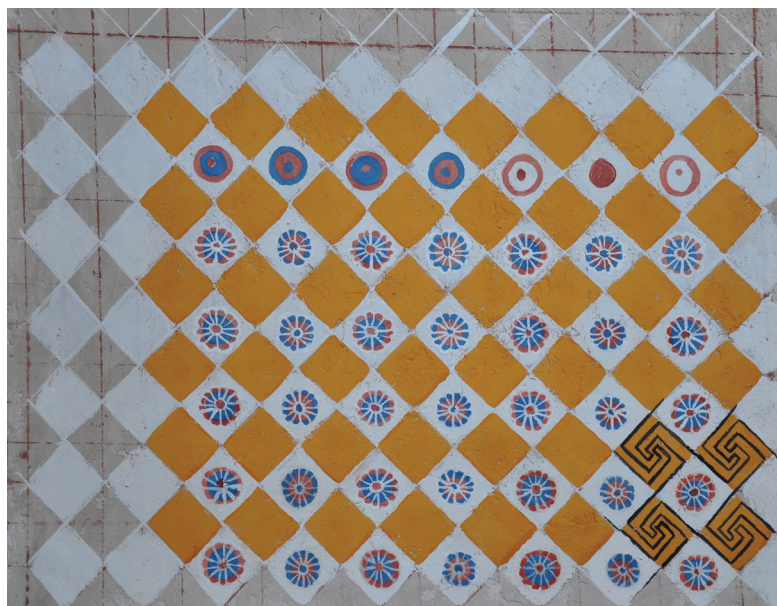
Fig. 9. Reconstitution à échelle réelle des phases de l'élaboration du décor du plafond de la salle transversale de la TT 81.