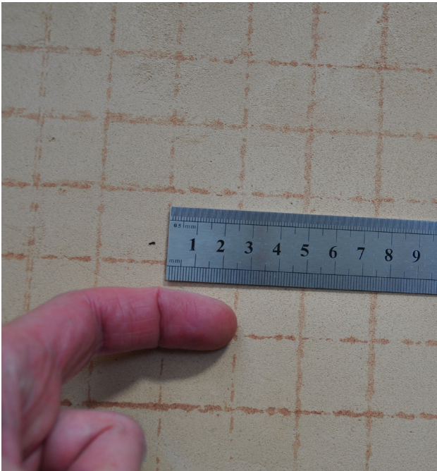
Fig. 6. Un quadrillage tracé à la ficelle. La première phalange de l'index a été utilisée comme unité de mesure. Le procédé est d'une étonnante précision.

les informations nécessaires à la reproduction du thème, en l'occurrence un thème en losanges. Sur un ostrakon moins soigné (Bruxelles, MRAH inv. E.2904) on voit, dessiné en noir et en rouge, trois séquences de la construction d'un thème à spirales et losanges. Il s'agit vraisemblablement d'un aide-mémoire technique destiné à être emporté sur le chantier. Tous ces documents précieux révèlent les procédés de fabrication de quelques motifs.