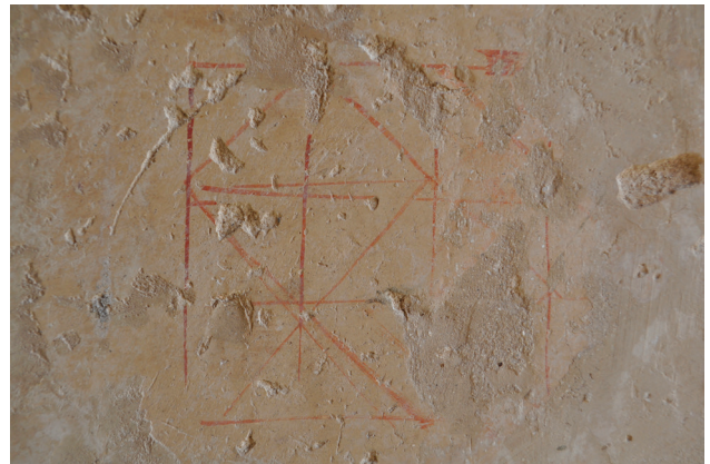
Fig. 5. Une esquisse rapide d'un motif en losange laissée par un peintre sur un mur de la TT 38.

référence placées dans une grille sommaire suffisaient à fixer le choix du thème et les bases de son agencement. L'absence d'indication de couleurs montre que les conventions implicites de leur répartition étaient bien connues des peintres. Des éclats de calcaire découverts durant les fouilles de la tombe de Senenmout (TT 71) présentent des esquisses de motifs de plafonds élaborés en couleurs sur des grilles 15 . Elles ont pu servir de modèle ou d'aide-mémoire à des apprentis, un peintre expérimenté n'en ayant pas besoin. Dans ce même lot, des esquisses de thèmes complets tracées à l'ocre étaient peut-être des essais préparatoires destinés à évaluer et adapter la taille des motifs à la hauteur exceptionnelle de la chapelle. Un intéressant modèle réduit de décor de plafond, peint consciencieusement sur un petit éclat de calcaire retaillé et conservé au musée du Caire (JE 36407) semble, en revanche, être un modèle d'atelier destiné à consigner toutes