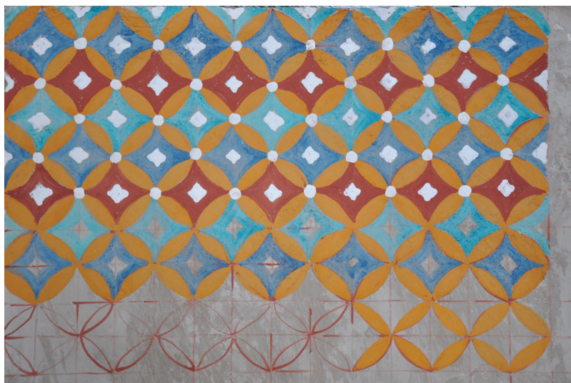
Fig. 10. Reconstitution à échelle réelle des phases de l'élaboration d'un thème décoratif en cercles concentriques.