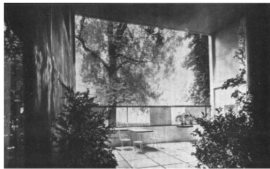
Vue de la loggia du pavillon de l'Esprit nouveau placée par Le Corbusier parmi les illustrations de son Almanach d'architecture moderne, puis régulièrement republiée par ses soins.

temps, Le Corbusier publie un nouvel ouvrage, qu'il définit comme le « Livre d'or » de l'exposition et qu'il nomme l'Almanach d'architecture moderne 10 . Sous cette appellation, il fédère un contenu hétérogène, qui devait initialement constituer le numéro 29 de la revue de l'Esprit nouveau . L'idée d'un almanach suggère aussi que Le Corbusier tient lui-même la chronique de son œuvre, encore en gestation, et pour laquelle 1925 aurait dû constituer une étape déterminante. Il y donne une description détaillée