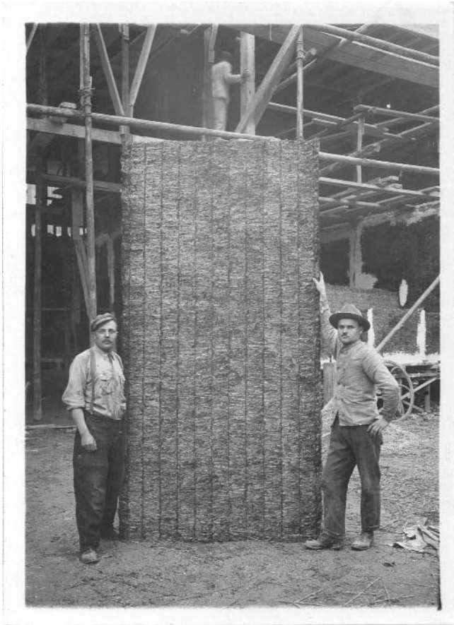
Une des quelques photographies du chantier du pavillon de l'Esprit nouveau conservées par Le Corbusier (FLC L2-13-43-001). Deux ouvriers manipulent un panneau de façade Solomite, en paille comprimée.

temps, Le Corbusier publie un nouvel ouvrage, qu'il définit comme le « Livre d'or » de l'exposition et qu'il nomme l'Almanach d'architecture moderne 10 . Sous cette appellation, il fédère un contenu hétérogène, qui devait initialement constituer le numéro 29 de la revue de l'Esprit nouveau . L'idée d'un almanach suggère aussi que Le Corbusier tient lui-même la chronique de son œuvre, encore en gestation, et pour laquelle 1925 aurait dû constituer une étape déterminante. Il y donne une description détaillée