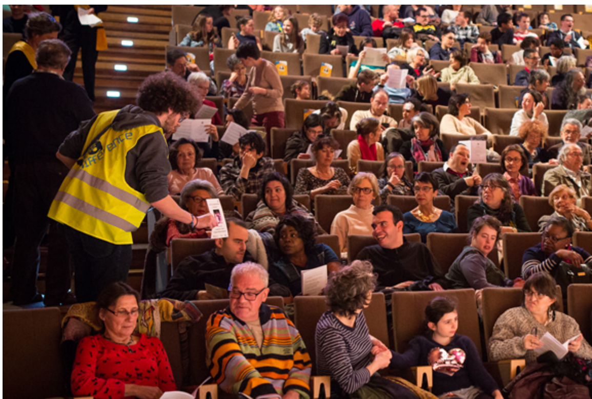
Un bénévole Ciné-ma différence distribue les livrets du spectacle Dream !

L'accessibilité étant au cœur de mon projet de faire découvrir Shakespeare à tous, j'ai eu envie d'étendre cette accessibilité à tous les publics, y compris à ceux que le handicap exclut des loisirs culturels. L'association Ciné-ma différence a accepté d'être le partenaire privilégié de la manifestation et de lui apporter son expertise et ses ressources. Nous avons donc proposé, sur le modèle de cette "séance pas comme les autres", une représentation « relax » en après-midi et une représentation classique le soir. Un petit film de trois minutes réalisé par la ville de Vincennes rend compte de l'atmosphère particulière de cette représentation et de la joie du public et des comédiens [2]. Les bénévoles de l'Association Ciné-ma différence et les bénévoles de Shakespeare d'Avril ! assurent un accueil privilégié à tous les spectateurs lors de la représentation « relax [3] ».