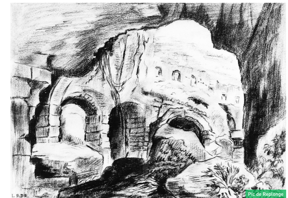
Pic de Replonge

Le cadastre dit napoléonien mentionne lui aussi un « Chemin du Château Bicêtre » qui dessert le vallon des Vaux de la Celle en passant au sud de l'étang des Moines. Aucune trace archéologique en revanche d'une telle structure dans le vallon qui aurait été un lieu fort peu adapté pour y installer un château fort.