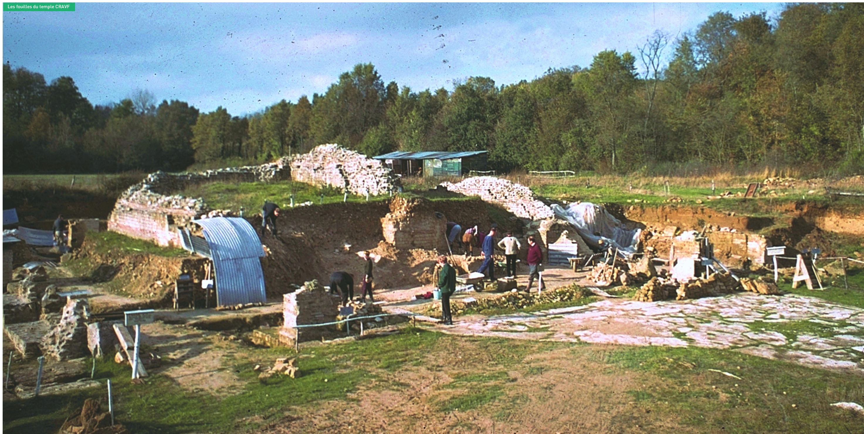
Les fouilles du temple CRAVF

inondations, de récupérer des engins mécaniques à droite à gauche... Comme le résuma très bien le chef de chantier, ces décennies sont aussi « une belle aventure humaine, celle d'une équipe d'amateurs, venus d'horizons professionnels très divers et par la même de compétences pratiques très variées à défaut de connaissances théoriques spécialisées dans ce domaine de recherche, rassemblés par une même passion et formés sur le tas, qui surent mener à bien, avec des moyens parfois originaux, l'exploitation méthodique du site dont ils avaient obtenu la charge. »