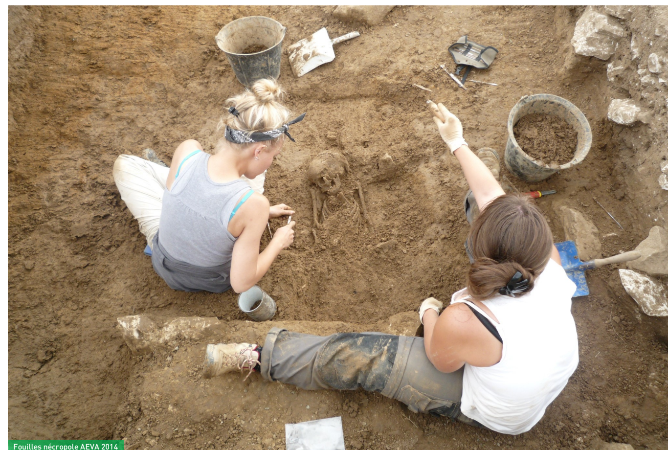
Fouilles nécropole AEVA 2014

ces sépultures a livré très peu de mobilier archéologique : les tombes les moins modestes comportaient de rares éléments de parure (bracelets, fibule, anneau ou torque) mais la plupart des fosses n'ont livré aucun matériel. Plusieurs datations radiocarbones (carbone 14) des ossements indiquent que le fond du vallon a servi de lieu de sépulture pendant environ 600 ans.