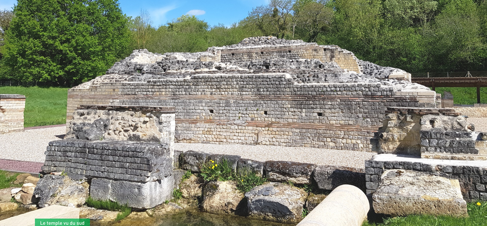
Le temple vu du sud

Les archéologues n'ont pas compris tout de suite que les vestiges monumentaux conservés, ceux du temple et de l'édifice de spectacle, faisaient partie d'une agglomération. Ce n'est que dans les années 1990 que la découverte d'une maison ( domus ) à étage et d'un quartier d'habitation organisé autour de rues, à l'ouest du temple, a remis en question la théorie jusqu'alors admise d'un site monumental isolé dépourvu d'habitats qui n'aurait