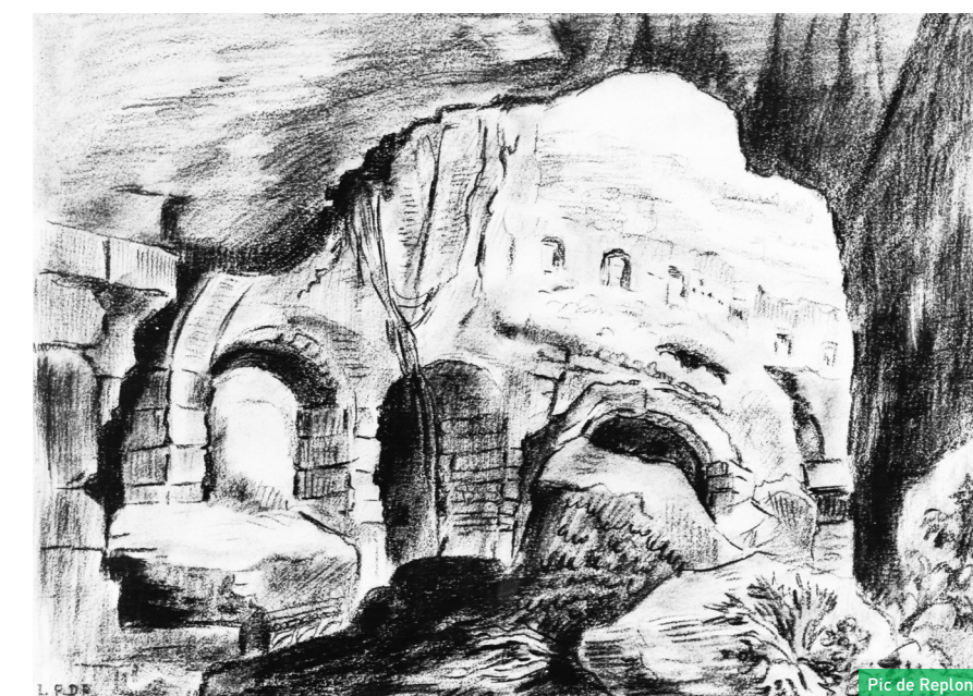
Pic de Replonge

Le cadastre dit napoléonien mentionne lui aussi un « Chemin du Château Bicêtre » qui dessert le vallon des Vaux de la Celle en passant au sud de l'étang des Moines. Aucune trace archéologique en revanche d'une telle structure dans le vallon qui aurait été un lieu fort peu adapté pour y installer un château fort.