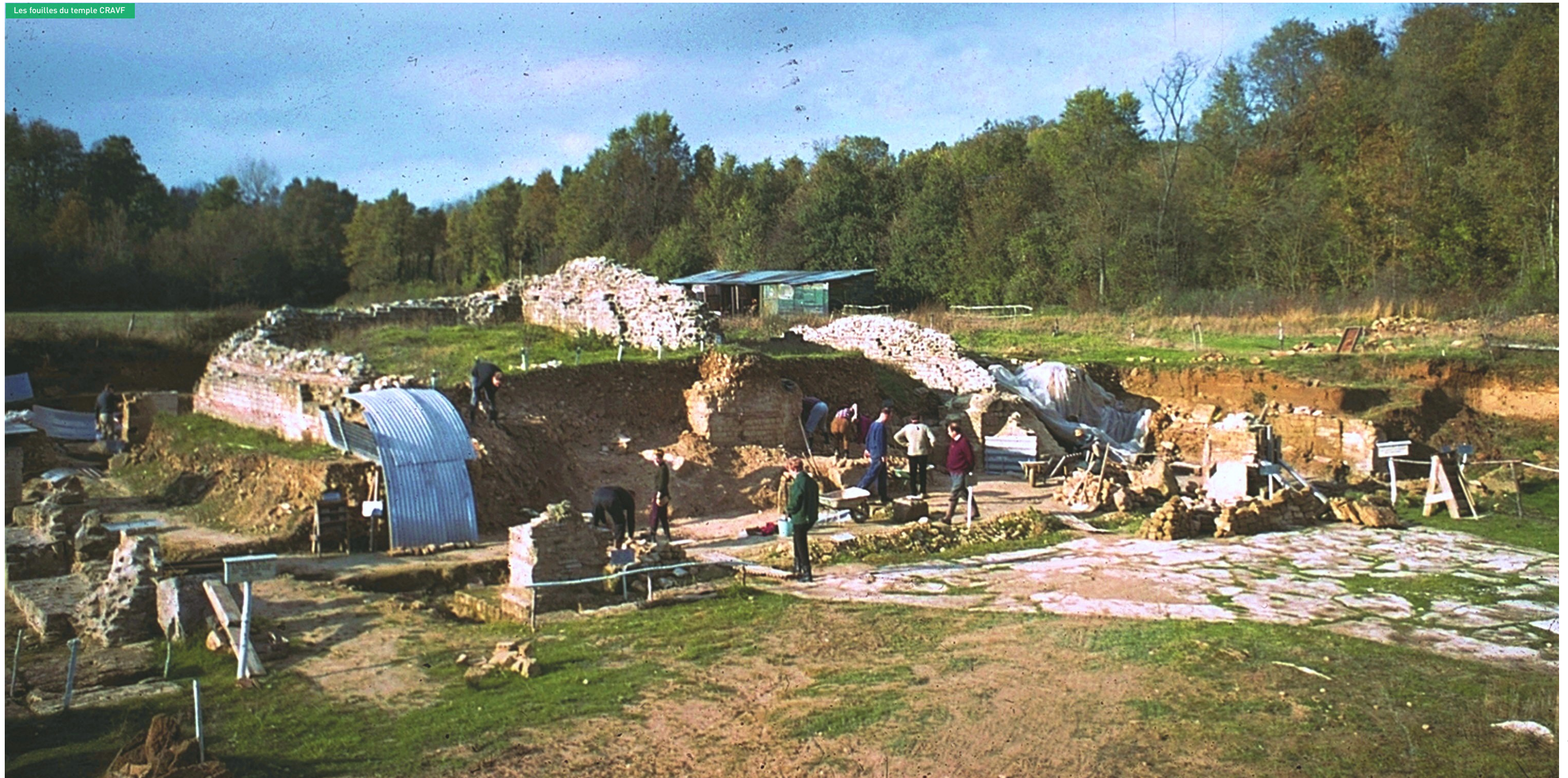
Les fouilles du temple CRAVF

inondations, de récupérer des engins mécaniques à droite à gauche... Comme le résuma très bien le chef de chantier, ces décennies sont aussi « une belle aventure humaine, celle d'une équipe d'amateurs, venus d'horizons professionnels très divers et par la même de compétences pratiques très variées à défaut de connaissances théoriques spécialisées dans ce domaine de recherche, rassemblés par une même passion et formés sur le tas, qui surent mener à bien, avec des moyens parfois originaux, l'exploitation méthodique du site dont ils avaient obtenu la charge. »