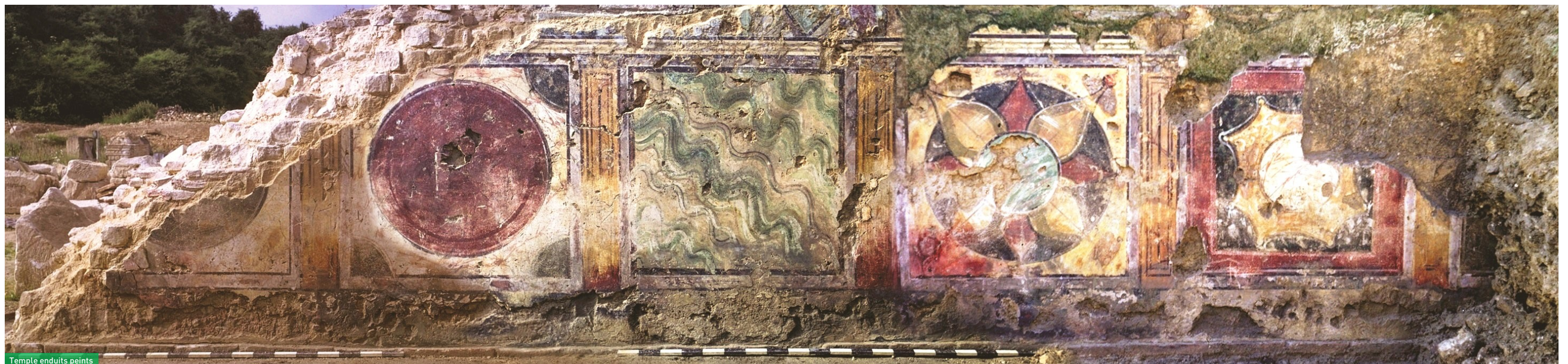
Temple enduits peints

Le long portique qui marquait l'entrée dans l'aire sacrée donnait sur une place, encore très mal connue, que les fidèles étaient obligés de traverser. Accolé sur les pentes du versant méridional du vallon, c'est au sud de cette place que s'élève un édifice de spectacle dont la façade est perpendiculaire au portique. On estime que ce grand édifice associant les gradins d'un théâtre semi-circulaire à l'arène ovale d'un amphithéâtre, avec sa façade de 115 m de long, pouvait accueillir environ 8 000 personnes. On distingue encore aujourd'hui une série de caissons maçonnés servant à contenir les remblais qui supportaient les gradins. Les gradins, quant à eux, ne sont plus visibles : la majorité d'entre eux ont été récupérés dès la fin de l'antiquité tandis que quelques-uns ont pu être mis au jour lors des fouilles.