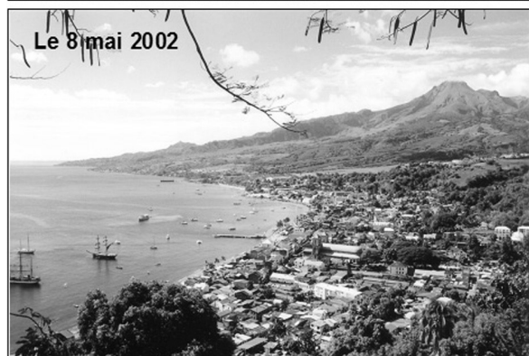
Photos 1 : Saint-Pierre et la montagne Pelée (sources : G. Landes, 1900 ; A. Lacroix, 1902 ; M. Desse, 2002).

d'un point de vue socio-économique et territorial et répond aux exigences d'un PPRn en permettant une valorisation dans un contexte réglementaire. Cette dernière cartographie a donc été retenue et adaptée pour la définition d'un PPRn Éruption volcanique.