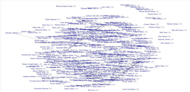
FIGURE – Réseau des bédéistes français en 1945