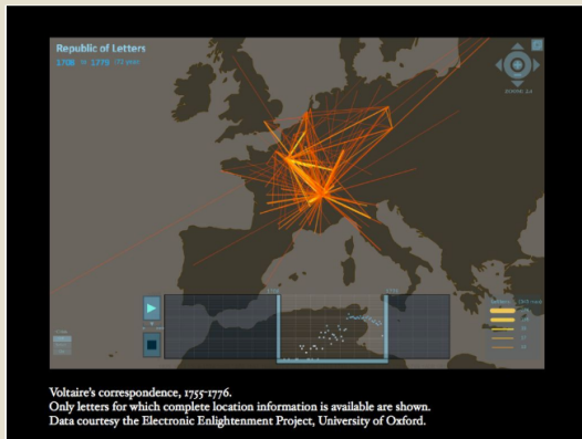
FIGURE – Visualiser la correspondance de Voltaire

We are also exploring the social make-up of Voltaire's correspondents. Who did he write to preferentially? What were their occupations? What was their milieu? These are some of the questions that underpinned the [visualization] we produced to explore Voltaire's network both cartographically and socially.