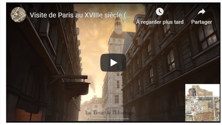
FIGURE – Restituer le passé sonore