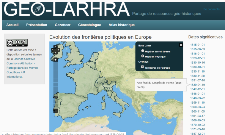
FIGURE – Evolution des frontières politiques en Europe