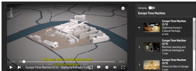
FIGURE – Exemple : La Venice Time Machine