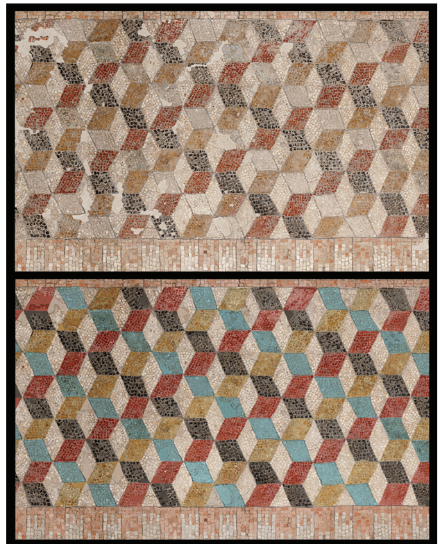
Fig. 2. Thmouis (Égypte), panneau du musée gréco-romain d'Alexandrie. En haut : détail après restauration ; en bas : détail après recoloration numérique (cl. P. Soubias, Archives CEALex, traitement A. Guimier).

Pour produire une restitution — toujours approximative — de l'aspect originel du panneau, nous avons procédé de la manière suivante. Sur une ortho-photographie, qui donne la géométrie exacte du panneau, nous avons superposé, avec le logiciel Photoshop, un calque coloré. La détermination de chaque couleur des losanges a été faite à partir de celles des traces de peinture. Pour retrouver la texture de la mosaïque, nous avons utilisé le mode de fusion "produit" de Photoshop qui permet de mélanger la couleur du calque avec celle des tesselles de la photo ; ainsi, dans une image colorée, sont conservés les contours des tesselles, leurs variations de teintes, leurs orientations, ainsi que les joints de mortier. Toutefois, ce processus assombrit excessivement l'ensemble et il est nécessaire d'éclaircir le calque pour obtenir un rendu satisfaisant des couleurs du panneau (fig. 2). En outre, lors