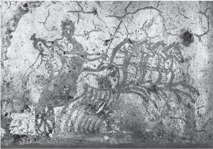
Fig. 6. Alexandrie (Égypte), nécropole de Kôm el-Chougafa, tombe 2 de Perséphone, détail de l'enlèvement de Perséphone sur le char d'Hadès (cl. et traitement A. Pelle, Archives CEALex, d'après Guimier-Sorbets et al. 2015, 92, fig. 130).

raison que nous avons insisté pour que ces images soient reproduites en noir et blanc dans l'article de publication 21 . Quinze années plus tard, la deuxième campagne de photographie des mêmes parois, avec une saisie numérique d'assez haute définition, toujours sous éclairage UV, a permis une bien meilleure lecture des scènes et une nouvelle interprétation de l'un des panneaux. Nous avons donc fait une nouvelle publication – sous la forme d'un ouvrage cette fois – en reproduisant les photographies (et non plus des peintures de restitution) de l'ensemble des scènes et de leurs détails 22 . Même si André Pelle, en saturant de façon sélective les couleurs des clichés sous UV, a tenté de retrouver la polychromie originelle des figures, il nous a semblé préférable de reproduire l'ensemble des panneaux en noir et blanc (fig. 6). En effet, les séries de traitements appliqués à ces clichés numériques risquent de fausser les couleurs originelles, dont en outre les pigments peuvent être diversement conservés. Sans validation des couleurs, même partielle, en vision normale, il nous paraît dangereux de tenter des recolorations sur la base unique de ces clichés pourtant si précis dans le rendu des formes.