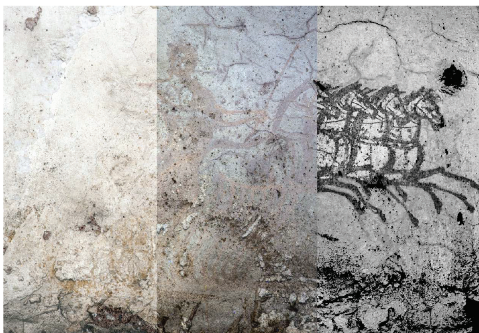
Fig. 5. Alexandrie (Égypte), nécropole de Kôm el-Chougafa, tombe 2 de Perséphone, détail. Apparition progressive de l'enlèvement de Perséphone : de gauche à droite, lumière naturelle, lumière UV et traitements (cl. et traitement A. Pelle, Archives CEAlex, d'après Guimier-Sorbets et al. 2015, 21, fig. 16).