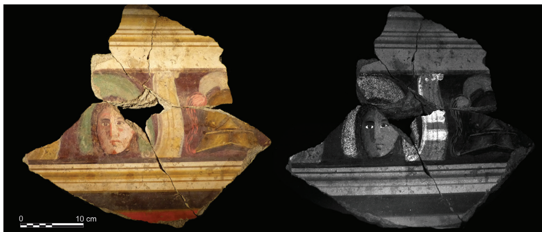
Fig. 8. Arles (France), maison de la Harpiste, corniche à console ; à gauche, photo en lumière naturelle, à droite photo VIL (cl. A. Guimier, MDAA/Inrap).