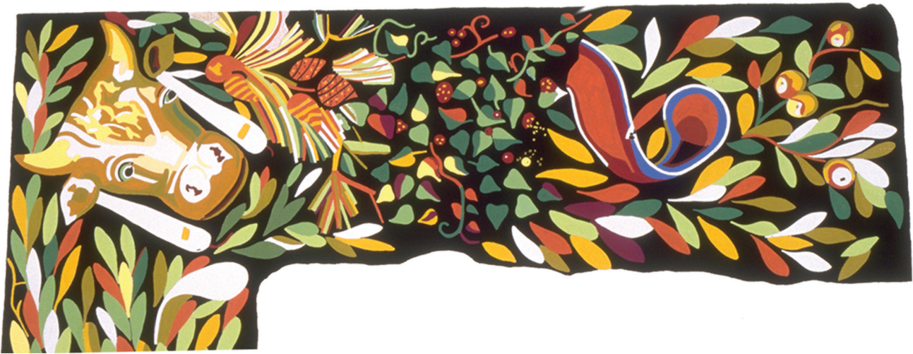
Fig. 3. Délos (Grèce), mosaïque de l'Ilot des Bijoux, détail de la bordure. Aquarelle N. Sigalas, École Française d'Athènes, d'après Guimier-Sorbets & Nenna 1995, 562, pl. III.

de la récente restauration du pavement, la teinte du mortier remplissant les lacunes avait été choisie en fonction de la tonalité générale du panneau ; il a fallu réaliser la même opération dans la restitution numérique, pour adapter la couleur du mortier des lacunes à la polychromie renforcée de la restitution.