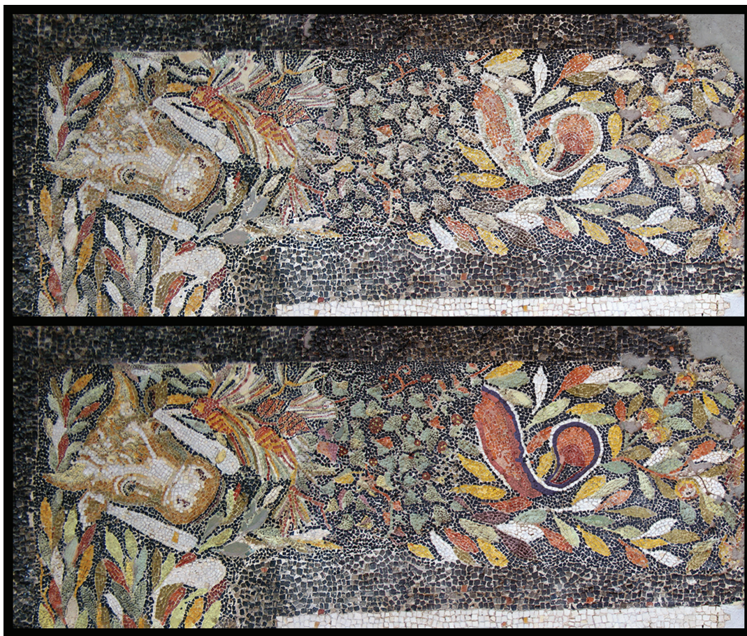
Fig. 4. Délos (Grèce), mosaïque de l'Îlot des Bijoux, détail de la bordure. En haut : état actuel après restauration ; en bas : détail après recoloration (cl. A.-M. Guimier-Sorbets, ArScAn, traitement A. Guimier).