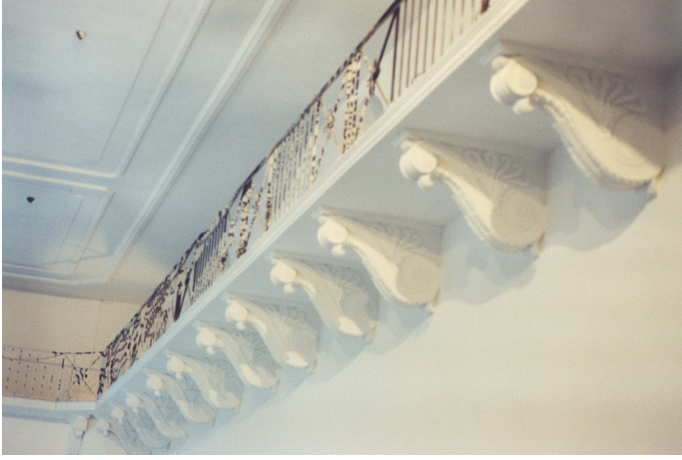
Figure 1. — La galerie. Cliché de l'auteur