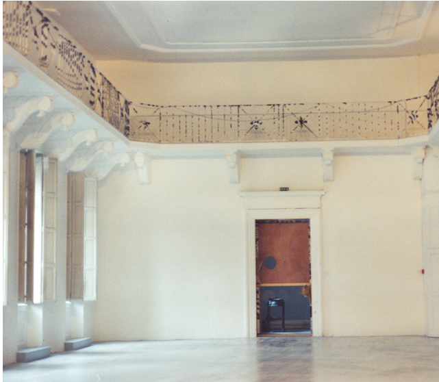
Figure 2. — La salle de lecture, vue d'ensemble.