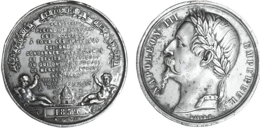
Figure 1. — Médaille de l'amnistie de 1859.

de l'Empereur : son mariage en janvier 1853, la naissance de son fils en mars 1856 ou, pour les 15 août, la Saint Napoléon).