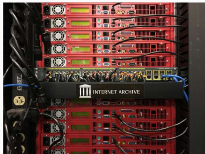
FIGURE : Stockage à la BnF