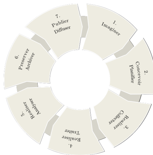
Fig. 1 – Cartographie des actions des réseaux métiers autour de la gestion des données.

Gérer les données de la recherche est un processus complexe qui suppose un travail long et coûteux, des moyens techniques et humains parfois importants et qui comprend plusieurs étapes avant d'aboutir à la publication et l'archivage de données fiables, de qualité, respectueuses du droit des personnes et de la législation en vigueur.