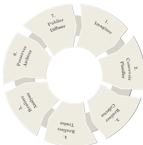
Fig. 1 – Cartographie des actions des réseaux métiers autour de la gestion des données.

Gérer les données de la recherche est un processus complexe qui suppose un travail long et coûteux, des moyens techniques et humains parfois importants et qui comprend plusieurs étapes avant d'aboutir à la publication et l'archivage de données fiables, de qualité, respectueuses du droit des personnes et de la législation en vigueur.