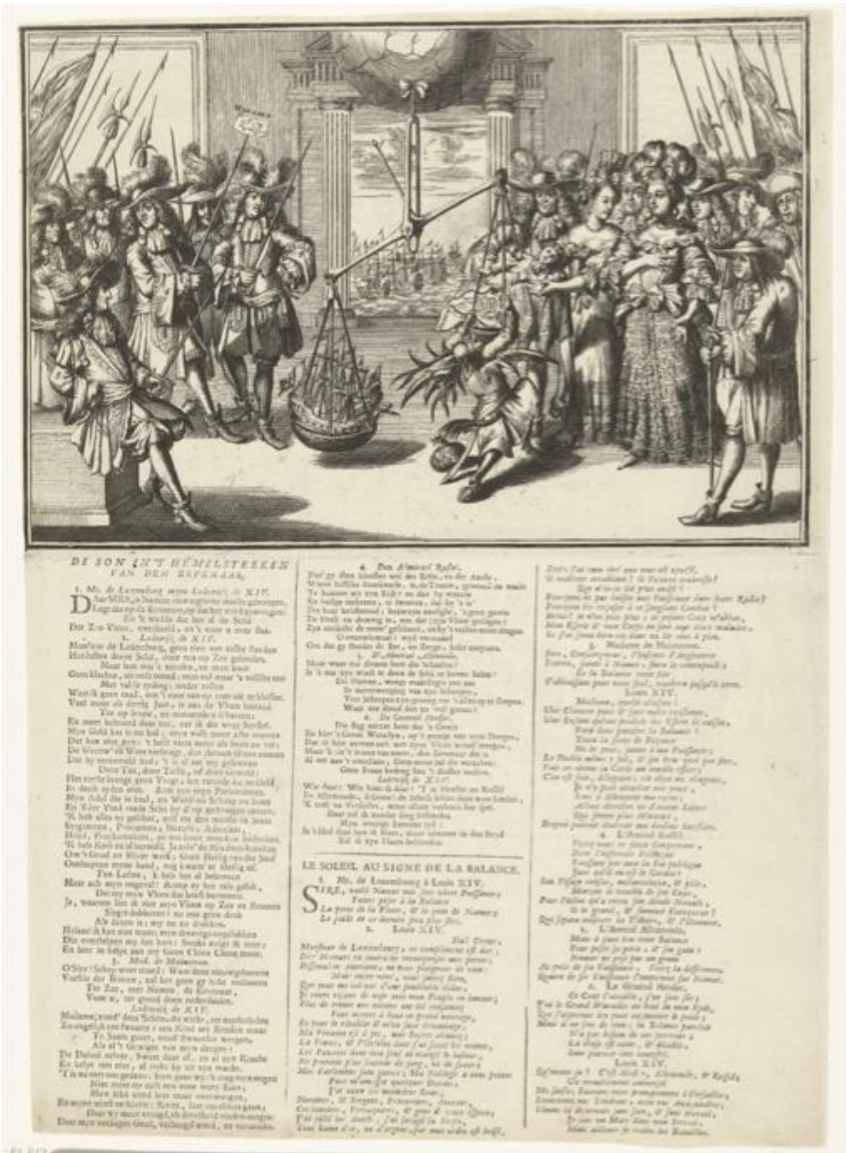
Figure 8: Anonyme, De son in't Hemelsteeken van den evenaar / Le soleil au signe de la balance , 1692, eau-forte, 41,3 x 28,9 cm, Rijksmuseum, RP-P-OB-82.817.