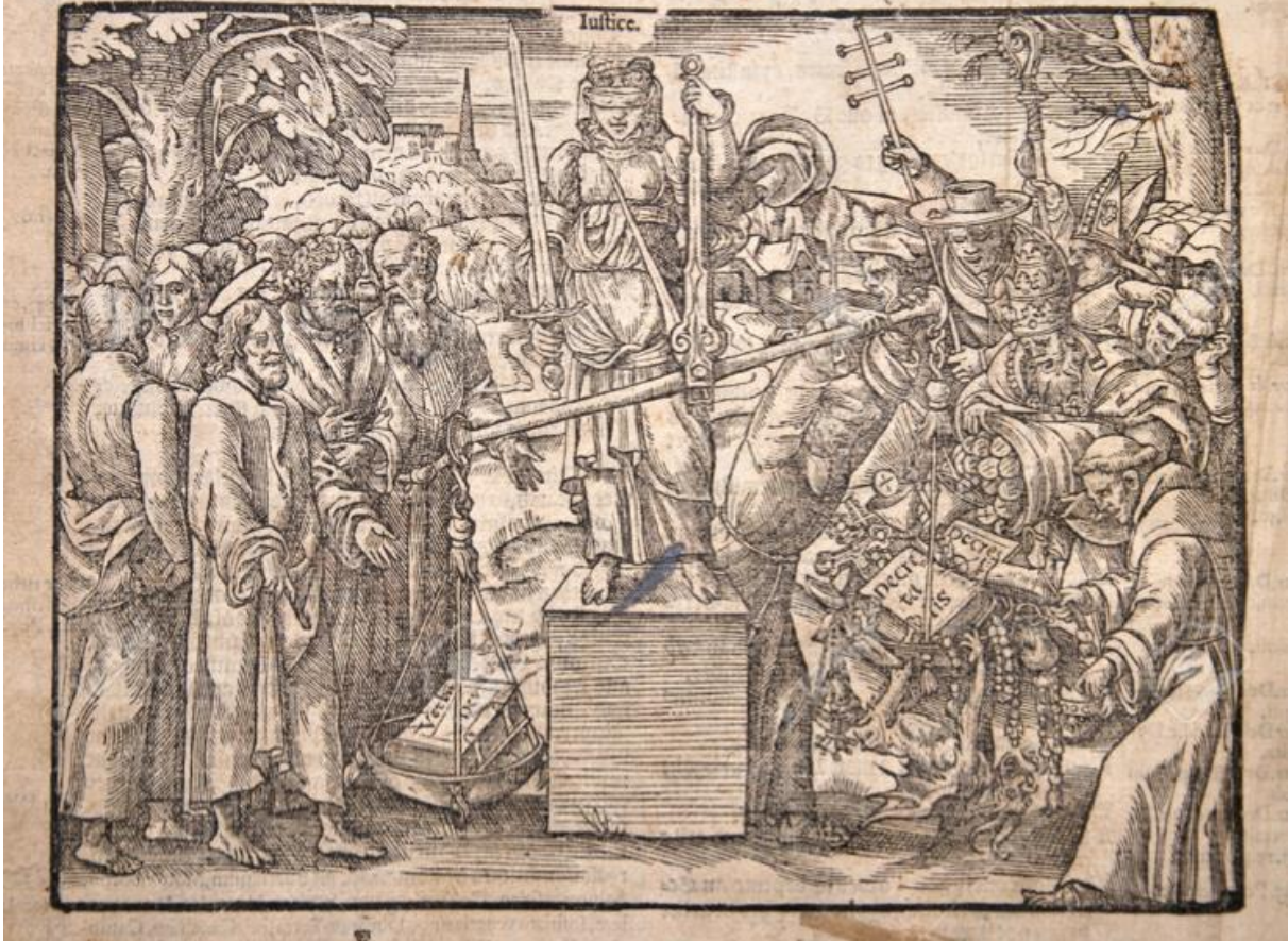
Figure 9 : Anonyme, A lively picture describing the weight and substaunce of Gods most blessed word, against the doctrines and vanities of mans traditions , in John Foxe, Acts and Monuments , 1576.

A lively picture describing the weight and substaunce of Gods most blessed word agaynst the doctrines and vanities of mans traditions.