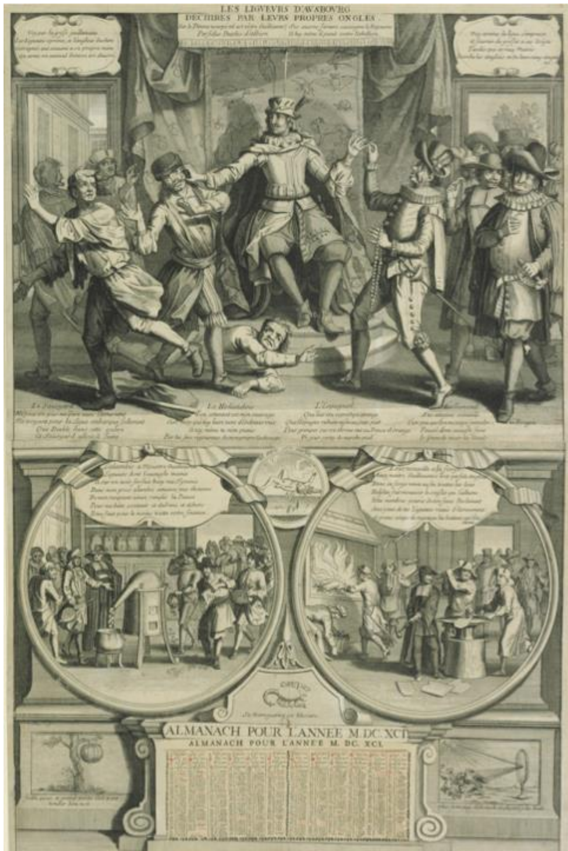
Figure 2 : Anonyme, Les ligueurs d'Augsbourg déchirés par leurs propres ongles , Paris, H. Bonnart, 1691, eau-forte et burin, BNF, cabinet des estampes, coll. Hennin, n° 5892.