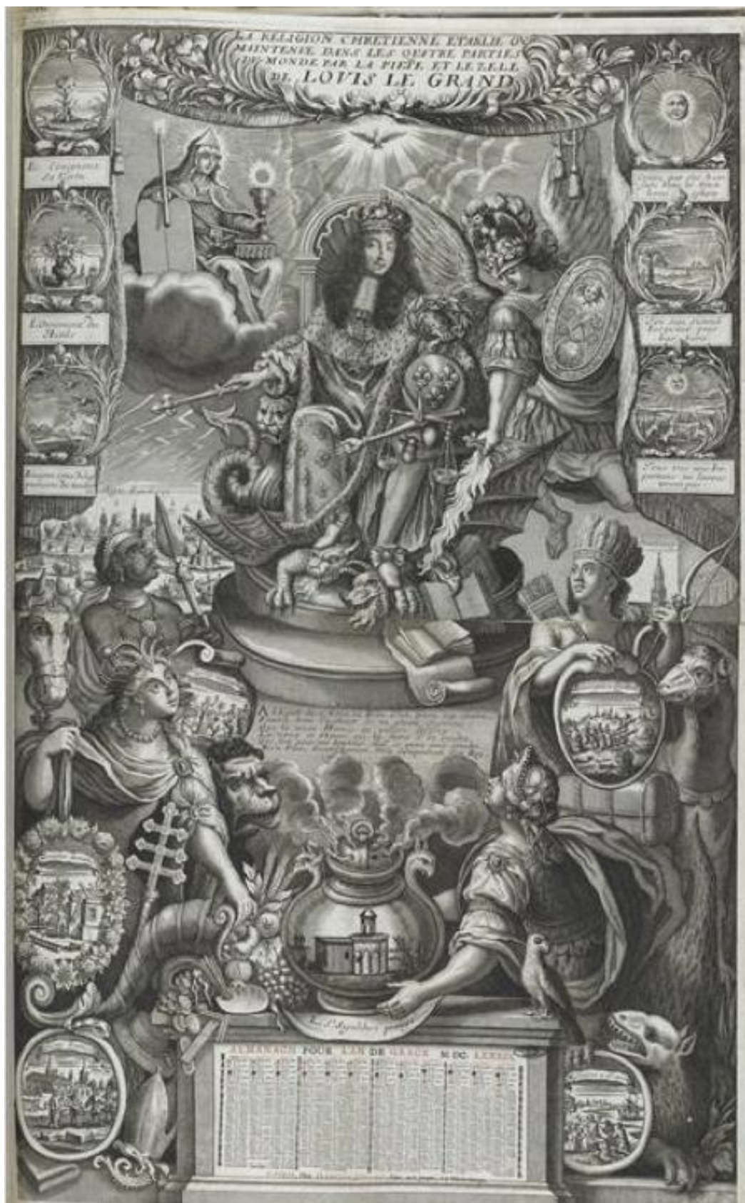
Figure 6 : François-Gérard Jollain l'Aîné, La religion chrétienne établie ou maintenue dans les quatre parties du monde par la piété et le zèle de Louis le Grand , 1689, almanach, Paris, bibliothèque de l'Institut, FOLAA66P-T1-page123.