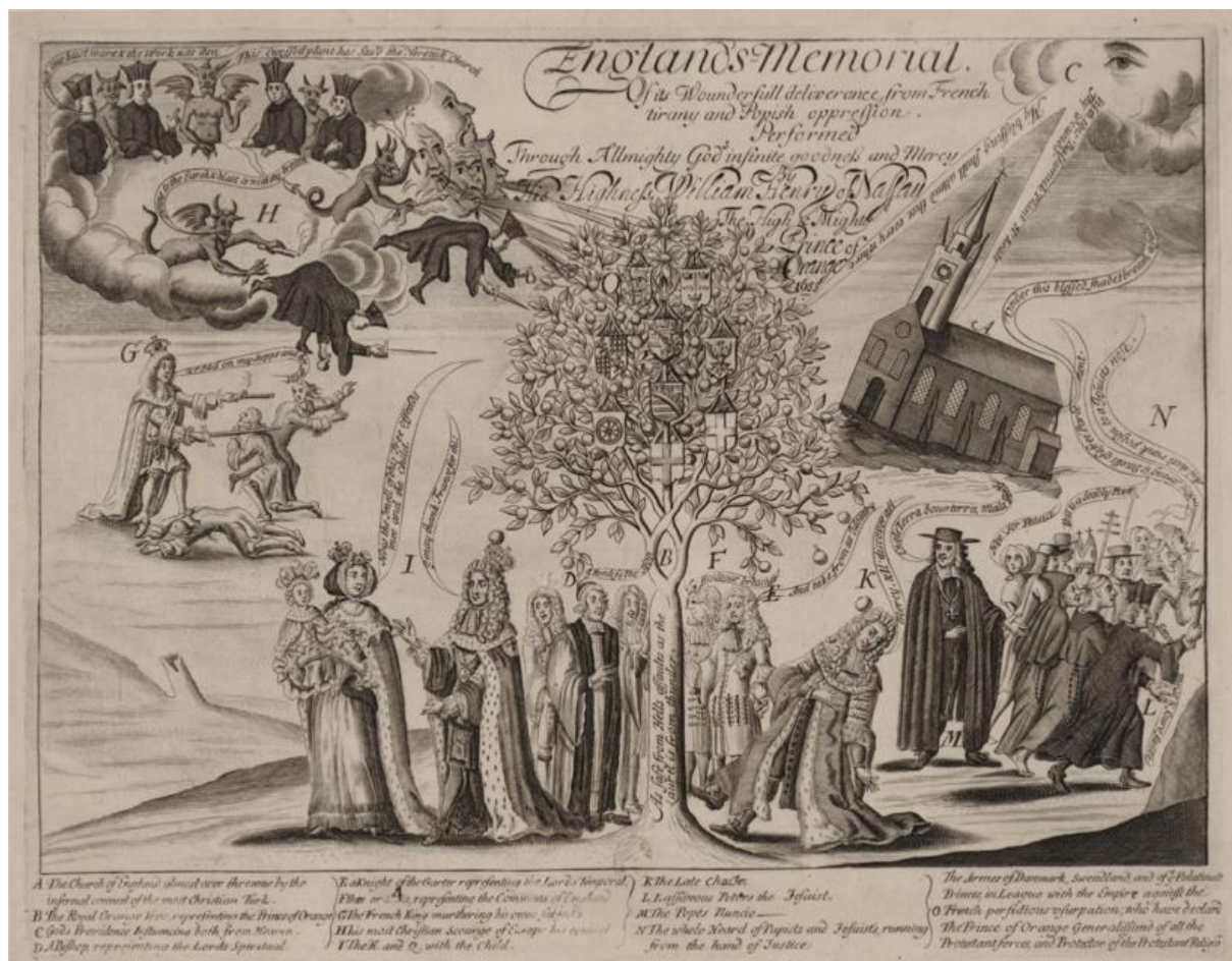
Figure 4: Anonyme, England's Memorial: Of its Wounderfull deliverance from French tirany and Popish oppression, Performed through Almighty God's infinite Goodness and mercy by His Highness William Henry of Nassau the high and Mighty Prince of Orange , 1689, taille-douce, 24,1 x 32,4 cm, BNF, cabinet des Estampes, coll. Hennin, n° 5648.