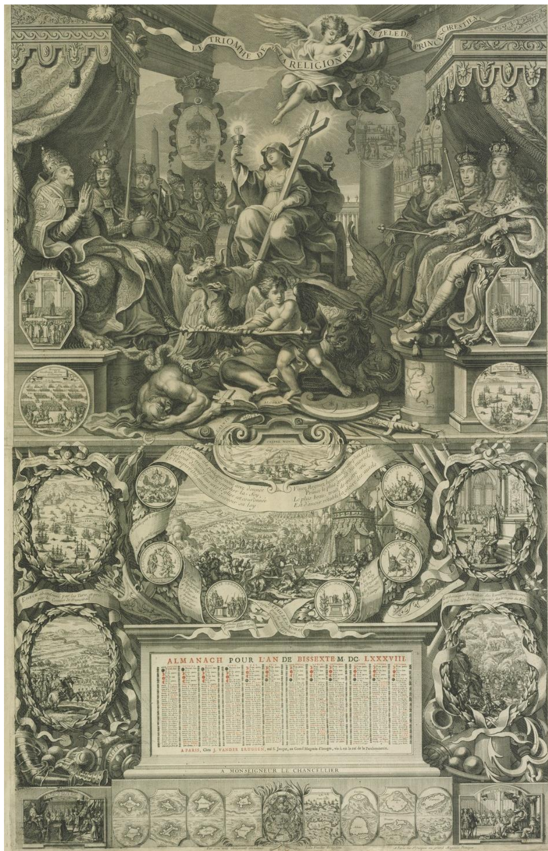
Figure 7 : Anonyme, Le triomphe de la Religion par le zèle des princes chrétiens , 1688, Paris, J. Vander Bruggen, almanach, 89 x 59 cm, BNF, cabinet des estampes, coll. Hennin, n° 5619.