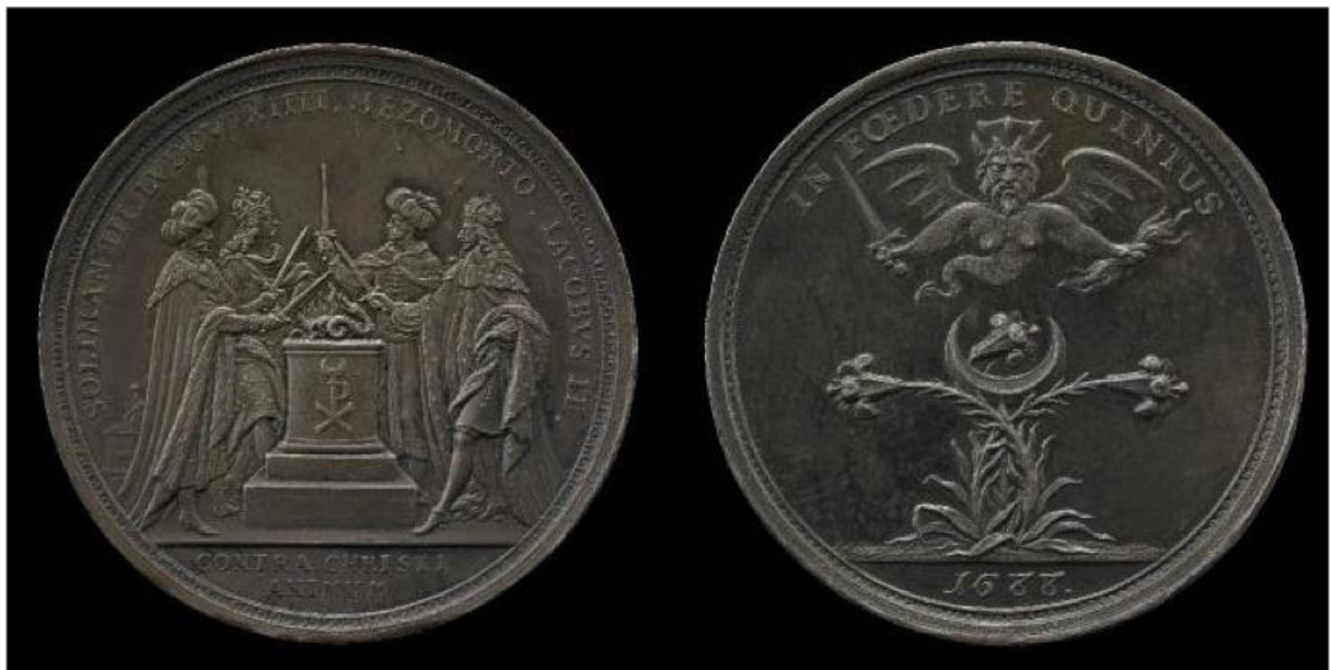
Figure 11 : Johannes Smeltzing, Alliance infernale , 1688, argent, 37 mm, British Museum, Numismatic Room, M.113.