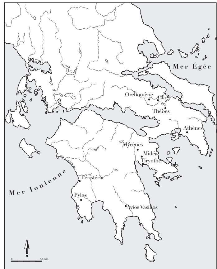
Fig. 1 – Carte figurant les sites mentionnés (R. Orgeolet).

De quelle nature ces derniers étaient-ils ? Aux alentours de 1250, un barrage d'une centaine de mètres de longueur et d'une dizaine de hauteur est aménagé en travers du cours d'eau qui jusque-là poursuivait son chemin jusqu'à la mer en passant au nord du Prophitis Ilias et à immédiate proximité de l'éperon de Tirynthe (fig. 3). Cette barrière artificielle a été ménagée avec la terre et les graviers extraits du canal avec lequel elle fonctionne, et renforcée de deux parements