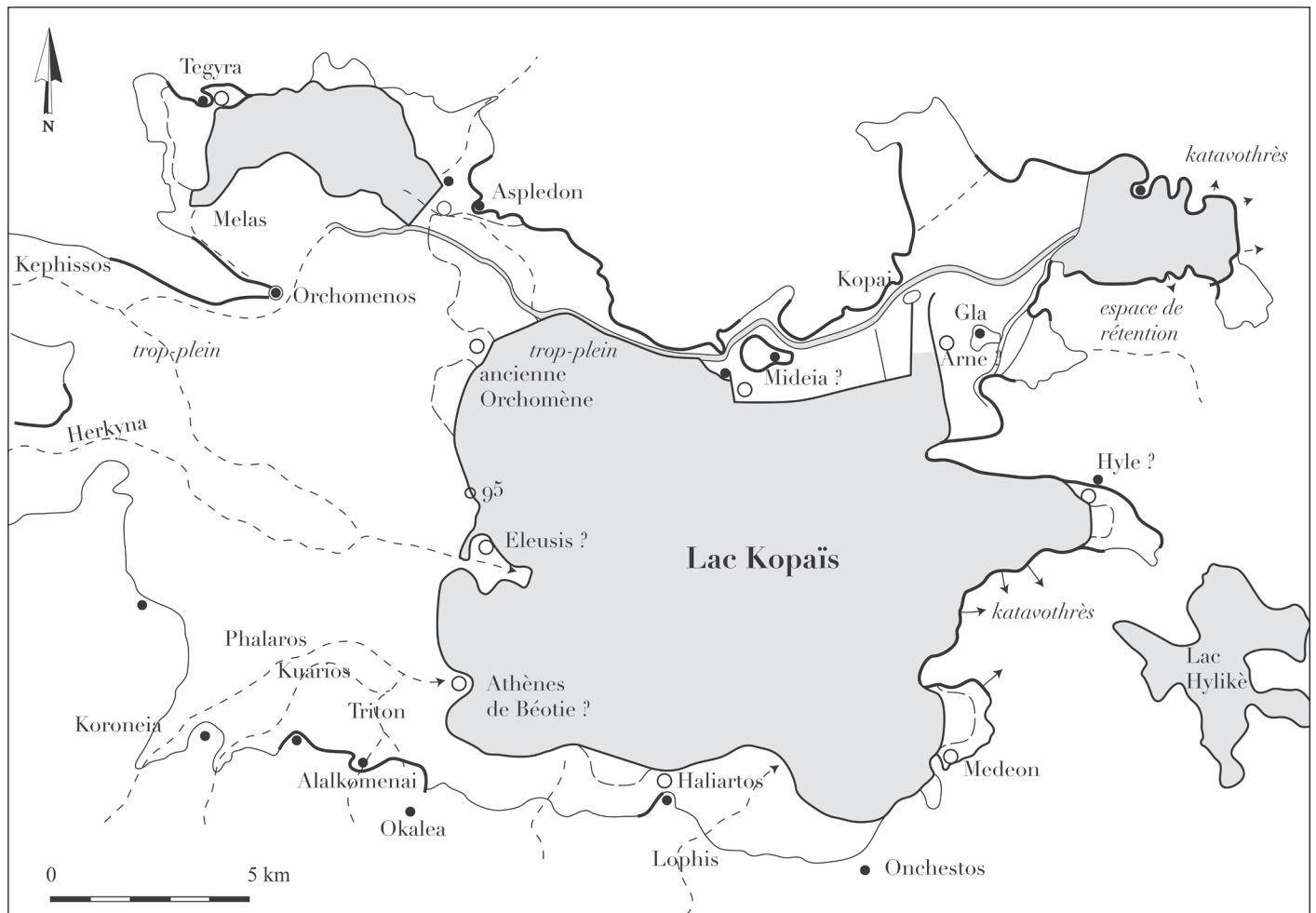
Fig. 2 – La région du Kopais et les aménagements hydrauliques (d'après Knauss 2004, fig. 12 p. 310).

en appareil cyclopéen. Le canal en lui-même est un ouvrage long d'environ 1,5 km, et aujourd'hui large d'environ 40 m pour une profondeur de 3 m (Knauss 1996 : 82-84). Mais il a manifestement subi des altérations sous l'action de l'érosion, ainsi que des modifications modernes : la physionomie qu'il arborait à la période mycénienne n'est pas totalement connue. Il permettait aux eaux ainsi détournées de rejoindre un autre cours d'eau passant au sud de la citadelle et de son agglomération, qui se sont alors trouvées hors d'atteinte.