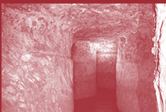
Aqueduc de Galermi (Syracuse), captage du Ciccio.