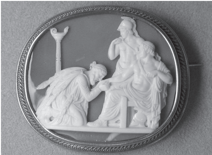
Figure 2. Priam suppliant Achille. Camée en onyx (1815-1825).

de Zeus, pleines de dons qu'il distribue ; l'une contient les maux, l'autre les bienfaits » (527-528). Le destin des hommes oscille entre ces deux pôles. De même, l'attitude d'Achille envers Priam mélange mansuétude et irritation, voire menace, tandis que Priam passe plusieurs fois de l'espoir à la peur. Finalement, sur ordre d'Achille, le corps d'Hector est lavé, posé dans un cercueil et placé sur le char à destination de Troie, après qu'Achille et Priam ont partagé un repas. Apaisés par la nourriture et la boisson, les deux protagonistes jouissent de la vue l'un de l'autre : Achille est grand et beau, semblable aux dieux ; Priam est noble et sage. Pour les humains, comme pour les dieux, le jeu des regards traduit les émotions et la reconnaissance mutuelle. Une trêve de douze jours, qu'Achille s'engage à faire respecter, permettra aux Troyens d'ensevelir Hector et de lui rendre hommage. Après quoi, le combat reprendra. Cette fois, Achille arrête la guerre non pas pour donner libre cours à sa colère, mais pour témoigner de son humanité.