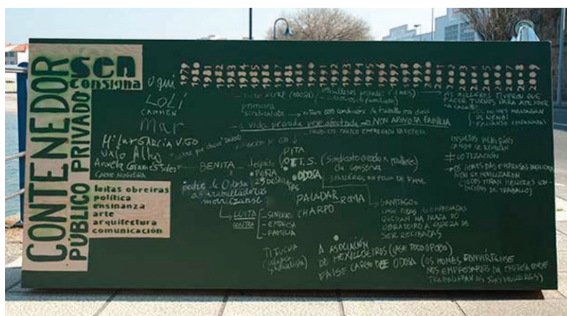
Fig. 2 – « Contenedor de feminismos », Docu-action n° 1, L'action des ouvrières de la fabrique de conserves, Vilaxoán, Arousa, 21 février 2009

Le fait que le « contenedor » puisse excéder son rôle assumé de réceptacle est alors perceptible dans l'invitation faite aux participant(e)s des docu-actions de témoigner par écrit sur la surface extérieure du « contenedor », transformé en tableau d'affichage ou en surface d'exposition ( Fig. 2 ).