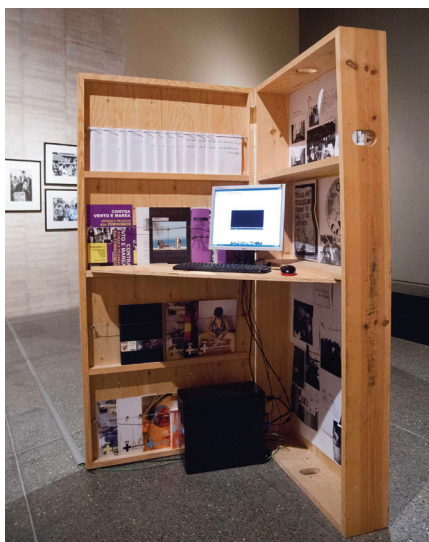
Fig. 1 « Contenedor de feminismos », Exposition Genealogías feministas en el arte español : 1960-2010 , MUSAC, León, juin 2012-février 2013