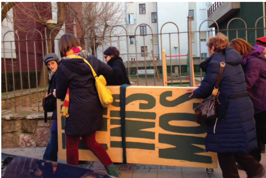
Fig. 3 – « Contenedor de feminismos », Docu-action n° 3, Activation du « contenedor » avec la collaboration du planning familial de León, janvier-février 2013

Nous pourrions aussi mettre en avant l'activation du « contenedor » réalisée dans le planning familial de León (janvier-février 2013), qui faisait suite à l'exhibition de l'installation dans l'exposition Genealogías feministas . Cette docu-action, qui put compter sur l'appui d'associations féministes de la province 12 , s'avéra tout aussi significative en termes de circulation : après un premier partage d'expériences et de documents, le « contenedor », alimenté par ces nouvelles sources, fut déplacé dans la rue – avec un passage de l'intime vers le public – (Fig. 3), où l'ensemble des actrices purent présenter leur démarche à des passants, associés à leur tour à la chaîne mémorielle des actions féministes actualisées.