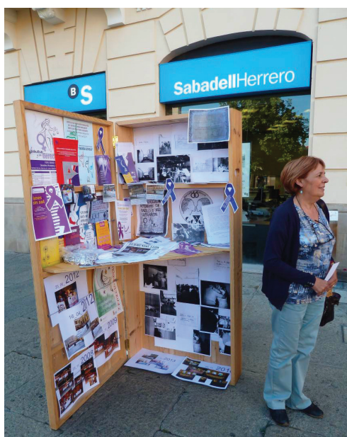
Fig. 4 « Contenedor de feminismos », Activation à León avec la collaboration de l'association ADAVAS (Aide aux Victimes d'Agressions Sexuelles et de Violences Domestiques), León, 3 juin 2013