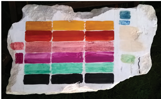
Fig. 6. Bloc de marbre avec des tests de couleurs réalisés à l'aide de différents liants (pigments : noir de vigne, vert malachite, cochenille, laque de garance, ocre rouge, ocre jaune / liants : œuf, cire et caséine) et quelques tests annexes en bordure.

directement sur la surface du marbre 20 : c'est donc ainsi que nous avons procédé. Nous avons également repris la plupart des pigments identifiés sur les monuments de Démétrias et pris en compte le fait que la présence d'huile et de protéines, sans doute de l'albumine, indiquait que la peinture avait pu être réalisée à l'œuf. Une autre source de documentation utile provenait des stèles alexandrines du III e s. a.C. conservées au musée du Louvre, bien étudiées par Agnès Rouveret 21 . Pour compléter cette documentation d'époque hellénistique, nous avons tenu compte des données connues pour les tablettes de Pitsa et la tombe du plongeur de Poséïdonia/Paestum (v. 475 a.C.) 22 , susceptibles de nous renseigner sur les techniques picturales de la fin de l'époque archaïque.