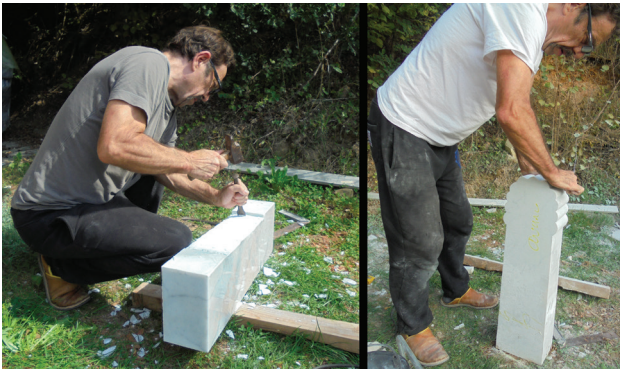
Fig. 4. Taille de la stèle par François Grand-Clément.

à lui donner l'aspect d'une stèle à anthémion conforme à ce que l'on connaît pour la fin de l'époque archaïque : une forme rectangulaire surmontée d'un décor de palmette stylisée (fig. 4). Le reste du décor était destiné à être rendu par la seule peinture iconographique principale.