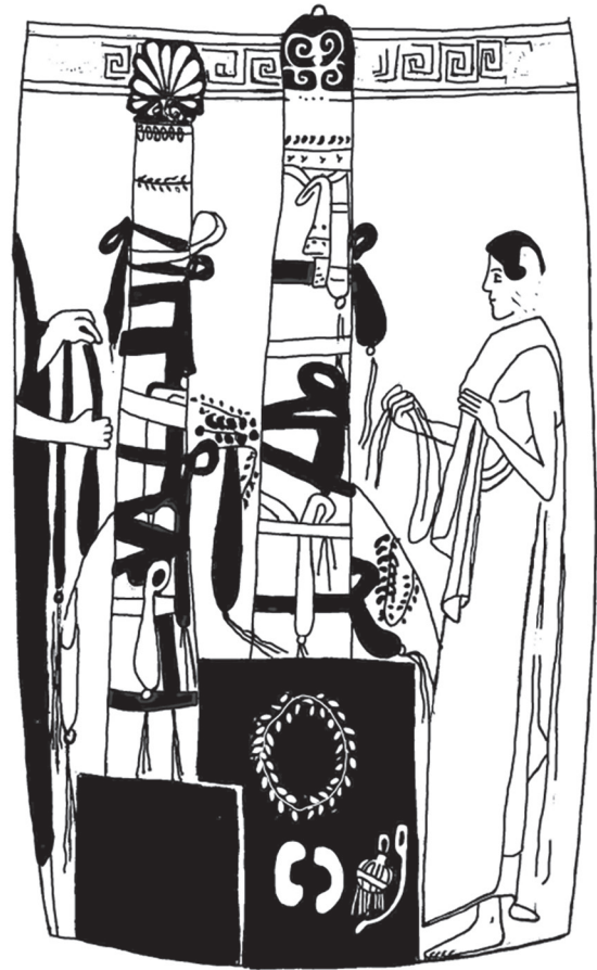
Fig. 9. Lécythe peintre de Vouini (vers 460-450 a.C.), New-York, Metropolitan Museum of Art, inv. 35.11.5 (dessin de N. Hosoi).

l'entrée du musée, où poussent deux beaux arbustes. Pour rehausser le parfum, quelques gouttes d'huile essentielle ont été ajoutées. Régulièrement, environ une fois par mois, le