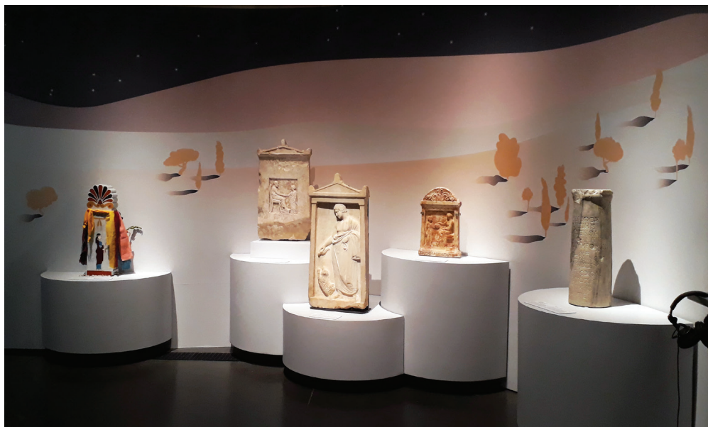
Fig. 3. Vue générale de la section des funérailles avec trois stèles et un cippe ainsi que, sur la gauche, la stèle expérimentale en couleurs créée de toutes pièces pour l'exposition ; on aperçoit aussi à droite un des dispositifs sonores de l'exposition.

relief. On peut légitimement supposer qu'il était également rehaussé de peinture à l'origine, comme le montrent de nombreux exemples, de l'époque archaïque jusqu'à l'époque hellénistique 11 . Nous ne disposons malheureusement pas de données archéométriques à ce sujet : aucune des trois stèles n'avait fait l'objet d'analyses spécifiques et leur surface ne laissait voir aucune trace de couleur visible à l'œil nu. Dès lors, comment sensibiliser les visiteurs de l'exposition au rôle joué par les couleurs dans les nécropoles et tenter de dissiper le mirage d'une "Grèce blanche" 12 ? Cette préoccupation nous a amenées à présenter, à côté des objets archéologiques, un essai de "reconstitution" polychrome. Le terme de "reconstitution" mérite ici une explication. Il ne s'agissait pas d'engager une entreprise analogue à celles menées par les équipes de V. Brinkmann, de P. Liverani ou de J.-S. Østergaard, qui visent à s'approcher au mieux, sous forme de reproduction matérielle – et non virtuelle –, de l'aspect qu'ont pu avoir certaines sculptures antiques sorties de l'atelier 13 . Nous avons pris délibérément la liberté de créer de toutes pièces un objet qui n'a jamais existé, en nous inspirant de plusieurs artefacts conservés. Nous avons veillé à respecter une stricte cohérence chronologique : les différents vestiges polychromes (stèles, reliefs, statues et tablettes votives) qui ont servi de référence