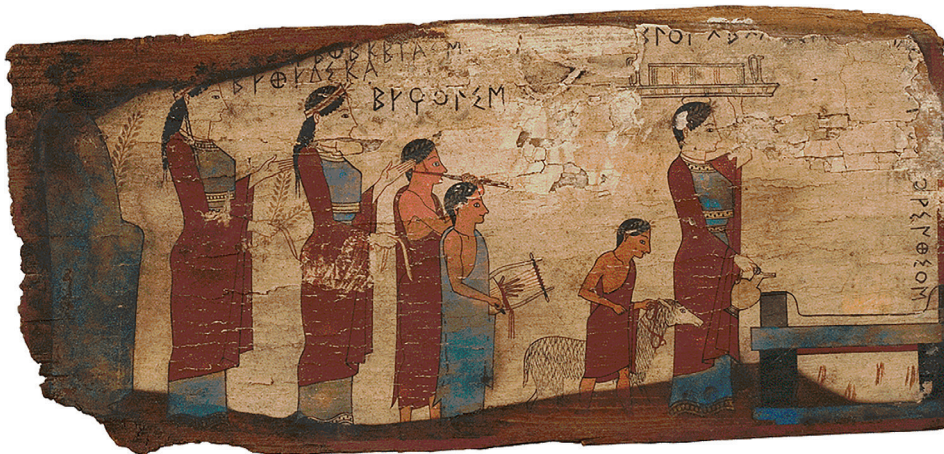
Fig. 5. Une des tablettes votives retrouvées à Pitsa (près de Corinthe), Pinax A, Athènes, musée national, inv. 16464 (v. 540-530 a.C.), bois peint, 33x15 cm.

La peinture a été réalisée le 6 novembre 2017, après avoir défini les pigments et les liants qui seraient employés. Au préalable, nous avons procédé à des tests sur un bloc de marbre (fig. 6), en ayant recours à la documentation disponible concernant les techniques picturales de décor des stèles funéraires grecques. L'essentiel du corpus connu date de l'époque hellénistique : le riche dossier des stèles de Démétrias, dont la peinture a sans doute été réalisée par des ateliers venus d'Athènes, nous a notamment servi de référence 19 . Les analyses ont révélé que, dans ce cas, les pigments ont été appliqués