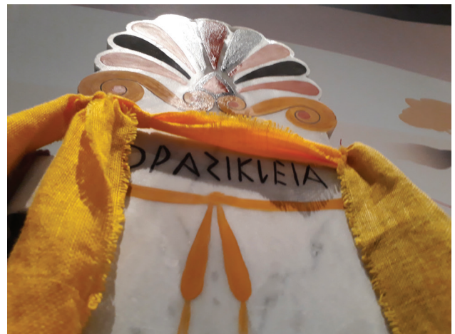
Fig. 10. Reflet de l'huile dispersé sur le haut de la stèle expérimentale vue en lumière rasante.