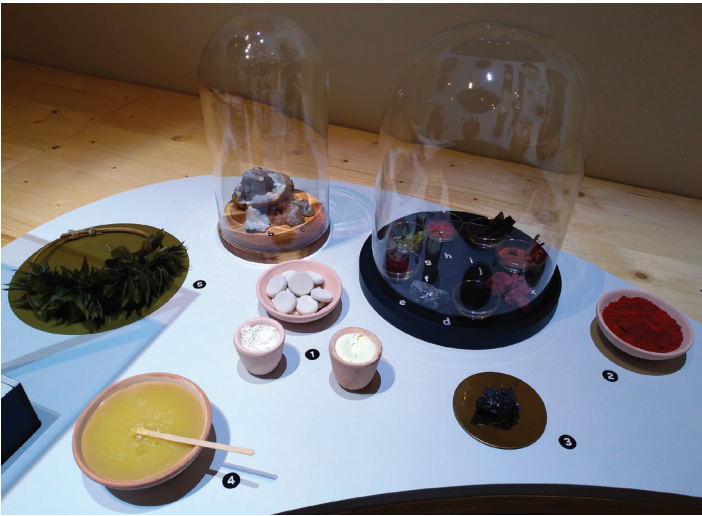
Fig. 1. Plateaux sensoriels réalisés par Amandine Declercq (Les fées bottées) : maquillage et autel avec offrandes végétales.