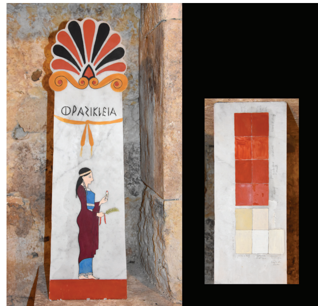
Fig. 8. Reprise de la peinture de la stèle : ajout du sourcil oublié et tests de couleurs (ocre rouge, blanc de plomb et craie) avec différents liants (jaune d'œuf, gomme arabique, caséine, blanc d'œuf) additionnés ou non d'huile de lin.

Aucun traitement de surface n'a été appliqué après la peinture, car nous manquions de données sur ce point. Nous savions que la stèle resterait en intérieur et pensions que le décor tiendrait ainsi toute la durée de l'exposition, c'est-à-dire cinq mois. Pourtant, au bout de deux mois, les couleurs de la carnation ont commencé à s'effacer peu à peu... La raison du manque d'adhérence de la couche picturale à cet endroit-là provient peut-être du mélange de pigments et/ou de leur réaction avec la caséine. Quoi qu'il en soit, nous avons procédé à une réfection de la carnation le 11 janvier 2018, in situ , à l'œuf cette fois et depuis lors, la peinture a bien tenu. La dernière intervention picturale sur la stèle a eu lieu après la clôture de l'exposition, le 3 novembre 2018 en atelier. Il s'agissait de réparer un oubli qui n'avait été relevé que par très peu d'observateurs : le sourcil, pourtant positionné lors