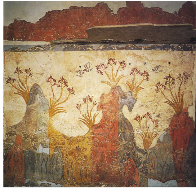
Fig. 3. "Peinture de printemps", Akrotiri, Théra (d'après Doumas 1992, 101, fig. 67).

artistiques comme les reliefs en stuc ou les objets de faïence, ornés d'incrustations ou d'ivoire.