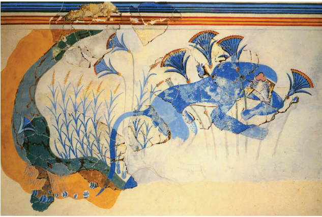
Fig. 2. Frise de la "Maison des fresques" à Knossos (d'après Morgan 2005, pl. 5, 2).