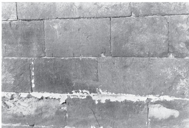
Fig. 6. Mur en blocs taillés dans le couloir 41 du palais de Phaistos (d'après Pernier & Banti 1951, 225, fig. 139).

Les façades bâties en blocs de pierre de taille, par exemple, étaient représentées dans une polychromie riche (fig. 4-5), tandis que la réalité archéologique diffère fortement : dans le monde égéen préhistorique, les murs extérieurs étaient très rarement recouverts d'enduit 23 ; et, dans le cas des façades en blocs taillés isodomes, il semble que seules les lisières aient généralement été enduites et, quelquefois, peintes 24 (fig. 6). Ce n'est donc vraisemblablement pas un hasard si, dans les représentations des murs en blocs taillés dans les peintures