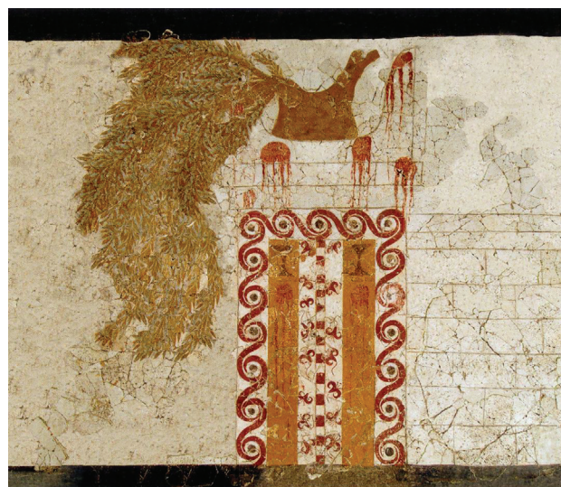
Fig. 7. Façade de sanctuaire sur une fresque de Xesté 3 à Akrotiri, Théra (d'après Marinatos 2016, pl. V b).

modèles d'architecture représentés en terre cuite peinte 29 , provenant tous de Knossos et datant de la fin de la période Minoen Moyen III, on retrouve exactement les principes de la "trichromie" du style de Kamarès (fig. 1), à savoir des couleurs libres, non liées aux objets et aux matériaux concrets, mais choisies selon les règles des ornements traditionnels 30 . Quant aux architraves en saillie, plusieurs exemples à Akrotiri portent un enduit 31 , tandis que la partie de l'architrave en