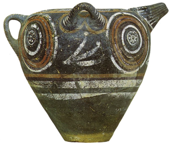
Fig. 1. Vase décoré selon le style de Kamarès, Phaistos (d'après Levi 1976, pl. XI a).

L'étape suivante dans le développement des "styles chromatiques" a lieu au début du Bronze Moyen en Crète et domine la période des "anciens palais", à partir du XX e jusqu'au XVII e s. a.C. Le style de Kamarès, dans la céramique (fig. 1) ainsi que dans d'autres médias artistiques, présentent un répertoire d'ornements composé par la "tricolore minoenne" : le fond en noir et le décor en blanc, parfois accentué par le rouge 8 . On peut définir cette préférence stylistique normative des genres artistiques de la Crète protopalatiale comme une "trichromie" ou bien une "oligochromie", mais nous sommes encore loin, en tout cas, d'un style vraiment polychrome. Quoique cette "triade de couleurs" (blanc, rouge et noir) soit largement concentrée sur le décor ornemental, elle constitue une étape intermédiaire importante dans l'évolution du chromatisme en Égée 9 .