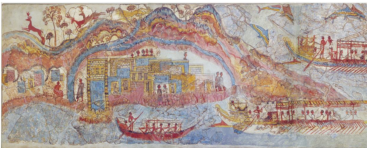
Fig. 4. Ville IV dans la frise de la "Maison de l'ouest" à Akrotiri, Théra (d'après Doumas 1992, 71-72, fig. 36).

l'Égée préhistorique 17 . C'était plutôt la polychromie elle-même qui possédait une signification, en adéquation avec l'environnement naturel.