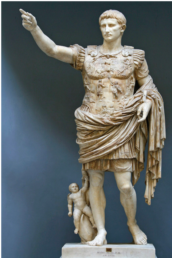
Fig. 1. Auguste de Prima Porta, 1 er s. p. C., musée Charamonti, Vatican, inv. 2290 (Creative commons : domaine public).