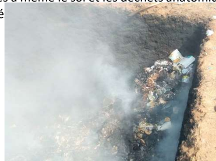
Figure 3. Brûlage à ciel ouvert des déchets d'activité de soins

brûlés à même le sol et les déchets anatomiques sont traités