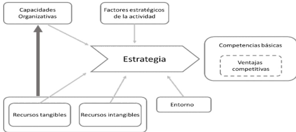
Figura 2. Modelo para generar ventaja competitiva