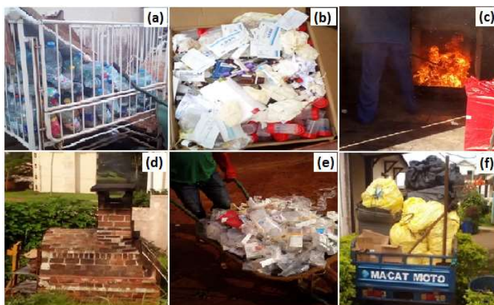
Figure 2. Stockage intermédiaire à (a) : l'HCY ; (b) : l'HJY ; (c) : incinération des DHs au Centre pasteur ; (d) : incinération des DHs à l'HCY ; (e) transport interne à l'aide de la brouette, (f) transport externe à l'aide d'un tricycle