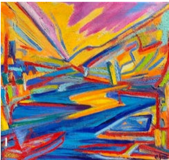
P. Interlandi, Scorrimento , olio su tela, 50x47 cm, 2020

che la politica economica e soprattutto la sovranità nazionale dovessero essere trasferite a un organismo sovranazionale europeo. Dalla nazione alla Comunità. Ma che cosa è successo, invece? È successo che tutti gli Stati aderenti hanno dovuto allinearsi alle direttive volute dall'Unione economica e monetaria, e che tutte le scelte inerenti questi campi siano condizionati dalle rigide direttive comunitarie. Il primo input verso questa unificazione politico economica è stato il piano Marshall, mentre di recente si è affermata la necessità di salvaguardare la stabilità della Zona Euro nel suo complesso. In che modo? Agli Stati viene imposto di contenere le uscite (intervenedo sulla spesa pensionistica e sociale, sulla sanità e l'istruzione, sul ridimensionamento della Pubblica Amministrazione) e di favorire le entrate (attraverso un piano di liberalizzazioni nei settori dell'energia, dei servizi pubblici, delle assicurazioni e telecomunicazioni), nonché di liberalizzare il mercato in toto, compreso quello del lavoro (introducendo una elevata libertà contrattuale che porta con sé un mercato flessibile e precarizzato). Ciò comporta un ampio mercato delle riforme in cui tutto deve convergere verso una politica di coordinamento europeo di tutto quanto venga intrapreso a livello nazionale.