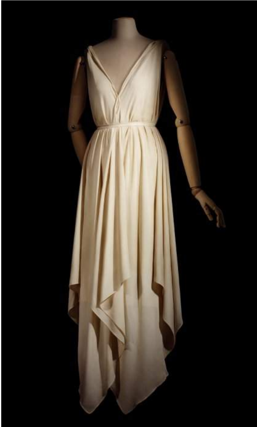
Robe de Madeleine Vionnet, hiver 1920, dite « Robe Quatre mouchoirs » 8