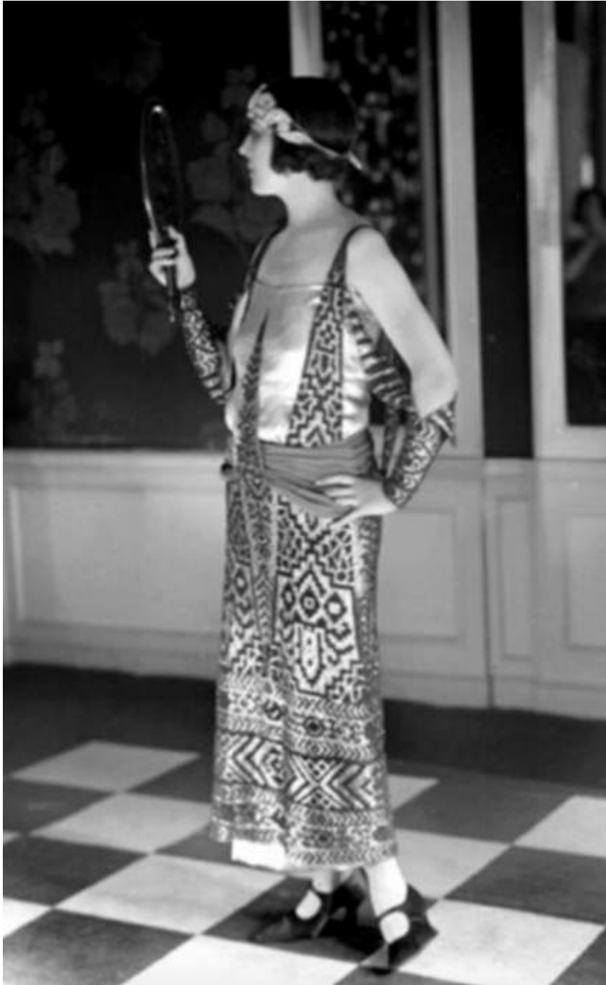
Paul Poiret, robe du soir ornée de motifs d'inspiration égyptienne, photographie de Boris Lipsinski, 1923 10 .