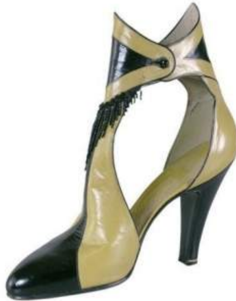
Chaussure Hellstern, 1925-1930, Musée international de la chaussure.