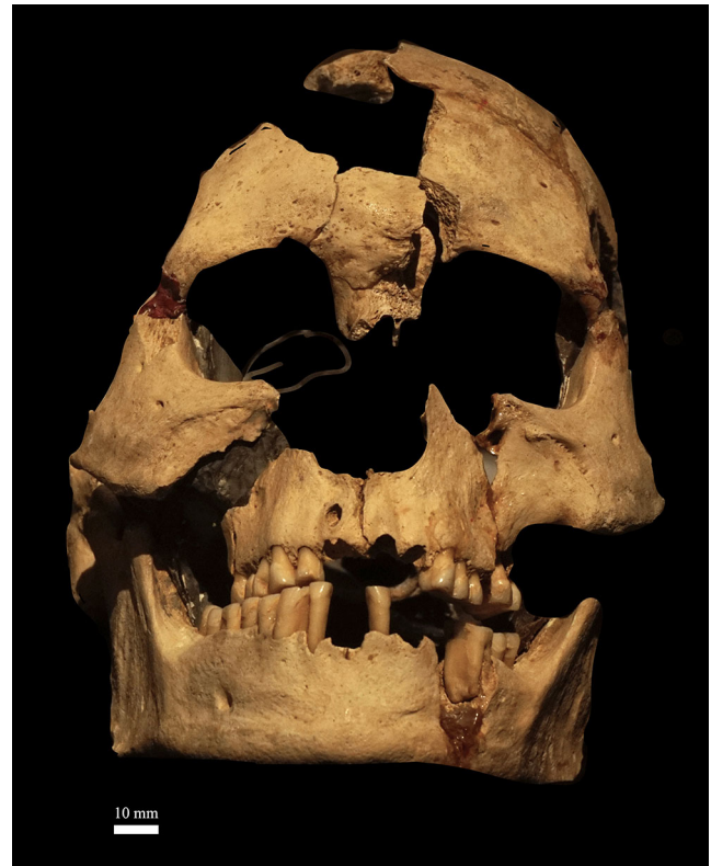
Fig. 1 Crâne et mandibule du sujet LP5, norma facialis (collection du musée Labenche — Ville de Brive ; photographie : M. Samsel) / The cranium and mandible of LP5, norma facialis (Collection of musée Labenche — Ville de Brive; photograph: M. Samsel)